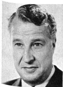
Von Ständerat Werner Jauslin, Präsident der Vereinigung zur Förderung der Wasser- und Lufthygiene, Muttens

Jede verbesserte Abgasanlage in Betrieben, jede neue Kläranlage, überhaupt jede Einzelmassnahme bringt eine Verbesserung. Da auch 1974 solche Teilschritte unternommen werden, kann man auf einen Fortschritt hoffen.