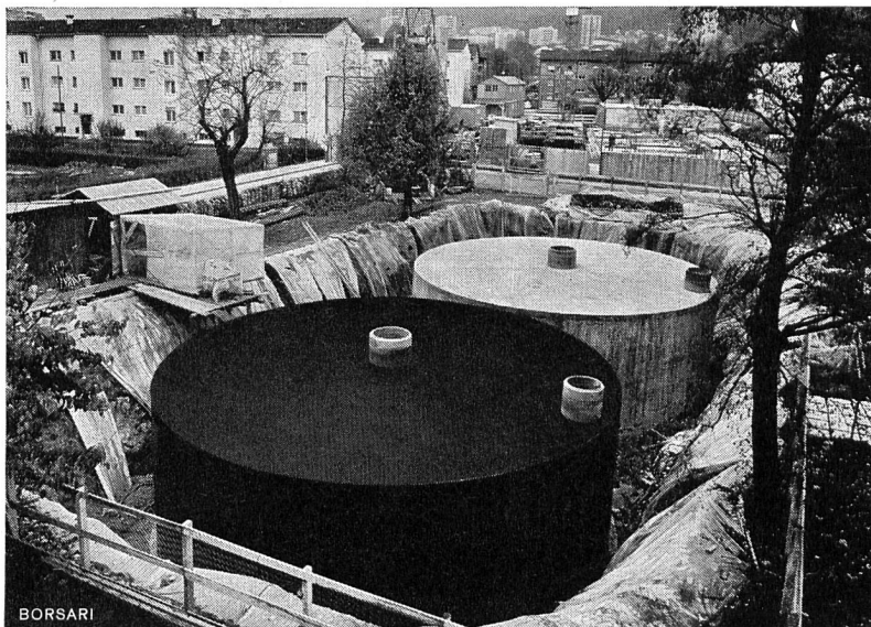
Gemeinnützige Baugenossenschaft Limmattal, Zürich 2 Tanks, total 1 000 000 Liter Heizöl