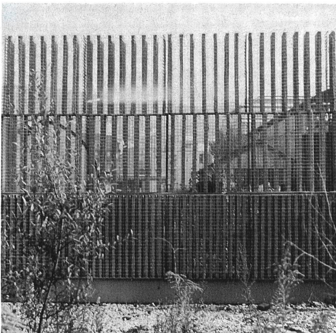
Abb. 2. Ein einzelnes Element im Detail

Die Forschung arbeitet intensiv an der Lösung dieses Problems. Da eigentliche Ueberdachungen oder Untertunnelungen der Strassen meist zu kostspielig sind (aus solchen Projekten resultieren automatisch Belüftungs- und Beleuchtungskosten), versucht man, den entstehenden Schall zurückzuhalten, sei dies nun mit einfachen Holzwänden (die den Schall zwar nicht zurückhalten, sondern nur wenig gemindert auf die andere Strassenseite zurückwerfen), mit Aufschüttungen längs der Verkehrsadern oder eben, wie im vorliegenden Fall, mit einem ausgeklügelten System von Schallschutzwänden, die, wie wir sehen werden, neben der eigentlichen Schalldämmung verschiedene andere Vorteile bieten.