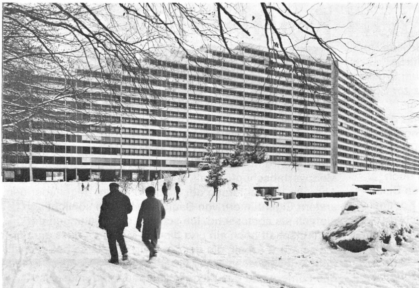
Grossüberbauung «Telli» Aarau

Wir offerieren Ihnen immer die umfassende Horta-Garantie für die Einhaltung von