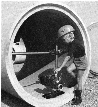
Mit dem neuen STOLZ-KANALBAULASER Modell 030/009