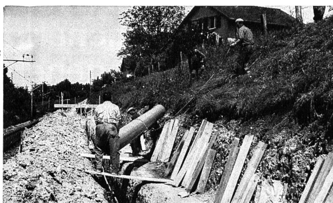
KALIDUR-Kanalisationsrohre, verlegt im Bahneinschnitt