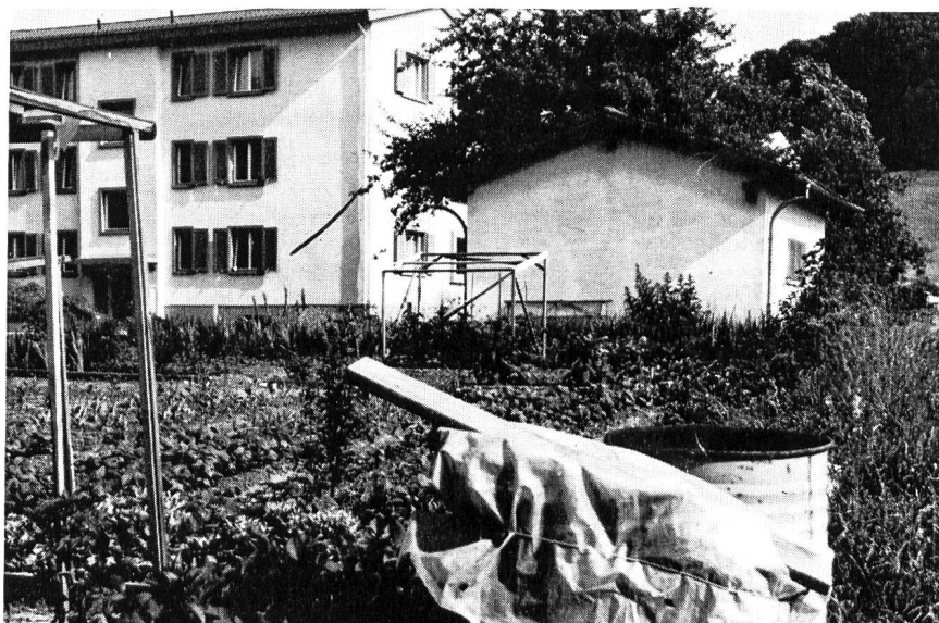
Abb. 1. Trinkwasserfassung ohne Schutzzone am Rand eines Wohngebiets. Eine Gemeinde hatte vor 25 Jahren in einer angemessenen Schutzdistanz von dem damals talaufwärts noch 150 m entfernten Baugebiet ein Grundwasserpumpwerk erstellt. Da keine Schutzzone ausgeschieden wurde, ist heute das Baugebiet mit Wohnhäusern und Gemüsegärten bis in die unmittelbare Nähe des Pumpwerks vorgerückt

Erst 1953 haben die deutschen Fachleute den Begriff der Schutzzone wesentlich erweitert. Sie nannten das bisherige engere Schutzgebiet jetzt «Fassungsbereich» und das bisherige erweiterte Schutzgebiet jetzt «Engere Schutzzone» und schlossen an diese beiden Teile des bisher schlechthin als Schutzzone zusammengefassten Gebietes eine «Weitere Schutzzone» an. In dieser forderten sie aber kaum mehr, als was auch bis anhin über allen nutzbaren Grundwasservorkommen zu den in Fachkreisen allgemein anerkannten Regeln des Gewässerschutzes und der Siedlungswasserwirtschaft gehörte und was deshalb von den Wasserwerkinhabern auch kaum verlangte, besondere Dienstbarkeiten zu erwirken. Im wesentlichen handelt es sich ausserhalb der im engeren Sinn verstandenen Schutzzonen darum, durch eine voll-