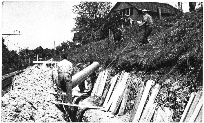
KALIDUR-Kanalisationsrohre, verlegt im Bahneinschnitt