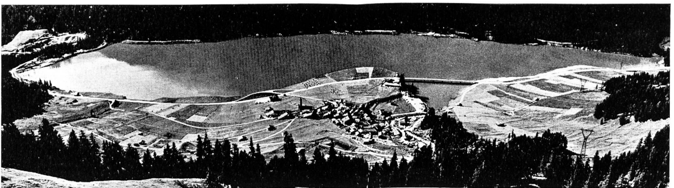
Abb. 4: Realersatz beim Kraftwerkbau Sufers GR. Einer der bedeutendsten Landerwerbe für die Kraftwerke Hinterrhein war jener für das Staubecken Sufers (90 ha). Hier wurde ein Beitrag im Sinne der Ortsplanung damit geleistet, dass alles Land zwischen See und Umfahrungsstrasse in das Eigentum der Kraftwerke übergeführt und dadurch vor der Ueberbauung geschützt werden konnte