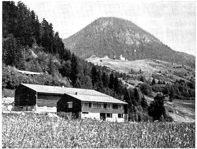
Abb. 1: Hof Simeon, Alvaneu GR