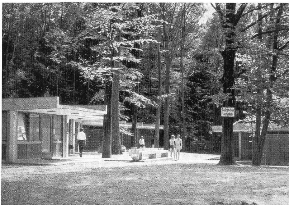
Abb. 1. Gebäude der Badeanlage Katzensee im Waldgebiet.

Anlässlich der Eingemeindung von Affoltern im Jahre 1934 ist dieser Badeplatz von der Stadt Zürich übernommen worden. Von diesem Zeitpunkt an wurde er von einem Badmeister beaufsichtigt. Vor einigen Jahren erstellte man eine Hütte für den Badmeister wie auch für Erste Hilfe bei Badeunfällen. Gleichzeitig sind auch einige behelfsmässig eingerichtete Aborte für die Badegäste zur Verfügung gestellt worden. Die ruhige und ideale Lage dieses Bades wurde von den Besuchern sehr geschätzt, und von Jahr zu Jahr stiegen die Frequenzen. Die Stadtverwaltung sah sich deshalb veranlasst, einen Architekten mit der Ausarbeitung eines Projektes zur Erweiterung der Umkleidegelegenheiten und zur Verbesserung der sanitären Verhältnisse zu beauftragen. Nach längeren