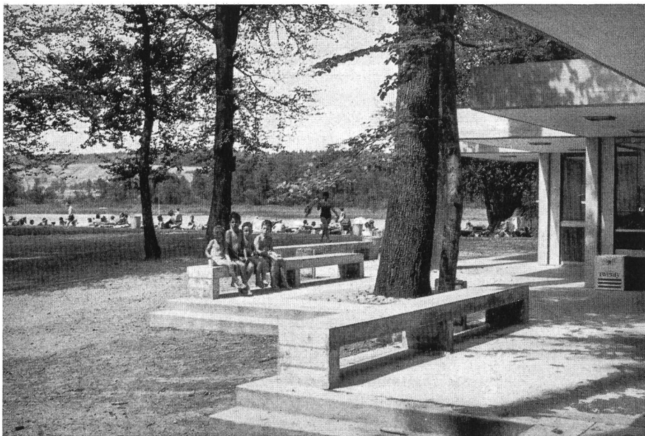
Abb. 2. Sitze aus Stein vor dem Kiosk.

Verhandlungen mit den Grundeigentümern, der kantonalen Verwaltung und den Organen des Natur- und Heimatschutzes war es dann Ende 1963 möglich, nach Genehmigung des Kredites durch den Gemeinderat an die Verwirklichung zu schreiten. Durch den Ausbau der Badeanlagen durfte jedoch das Landschaftsbild nicht beeinträchtigt werden.