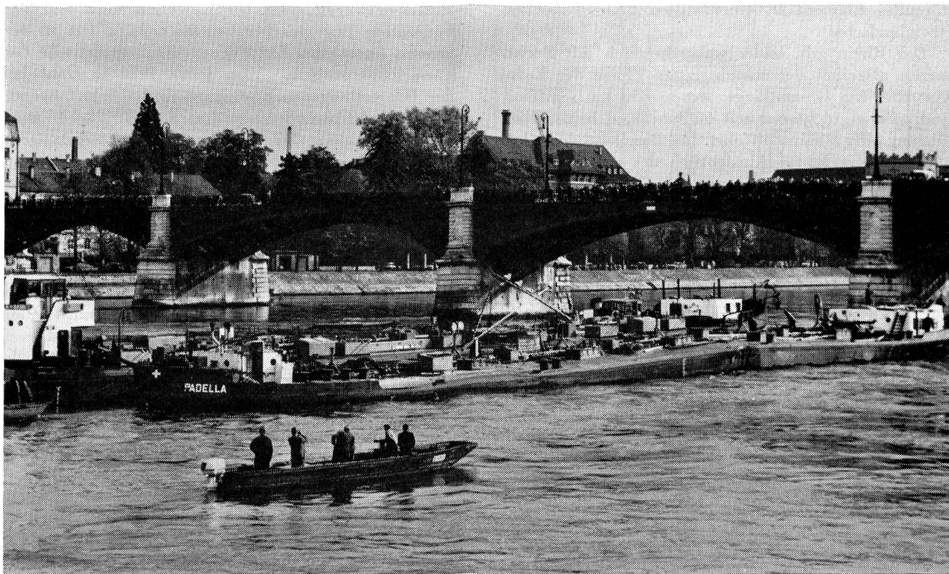
Abb. 1. Bergung des havarierten Oeltankers «Padella» in Basel.

Der jährliche, jeweils anfangs Januar in der Presse erscheinende Bericht des Rheinhafen-Direktors in Basel orientiert eingehend über das Tun und Lassen der schweizerischen Rheinschifffahrt. Indessen war auch im Bericht pro 1962 kein Wort über die Gewässerschutzbemühungen der Schifffahrt zu lesen. Dies darf jedoch nicht als betretenes Schweigen eines Sünders aufgefasst werden; anscheinend wollte man auch von Amtes wegen nicht diese Problematik zur Diskussion stellen, weil auch bei bestem Willen und positiver Einstellung der Schifffahrtskreise zu den Gewässerschutzbemühungen die Frage allfälliger Verunreinigungen durch die Schifffahrt, durch Umschlagsanlagen, durch Lagermöglichkeiten ein nicht sehr einfach zu lösendes Problem darstellt.