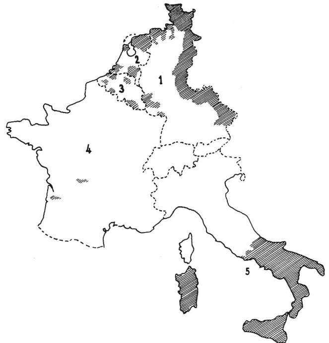
Abb. 2. Die Regionalplanung in den EWG-Ländern, 1962.

Historisch betrachtet, ging die in der Agglomeration Paris feststellbare Zentralisierung mit einer ununterbrochenen Vernachlässigung der Provinzen einher. Allgemein gesehen, ist das ganze Gebiet südwestlich einer von der Bretagne bis zu den Alpen gezogenen Linie im Verhältnis zu den übrigen Regionen des Landes wirtschaftlich und sozial zurückgeblieben. Mit Ausnahme einzelner wichtiger Agglomerationen wie Marseille, Toulouse, Bordeaux und Nantes weist dieser Teil Frankreichs eine wirtschaftliche und vor allem industriell unterdurchschnittliche Entwicklung auf. Um diese für die Volkswirtschaft kostspielige Dis-