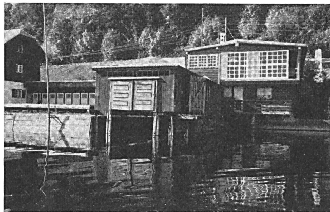
Abb. 3 und 4. Uferverbauungen am Wallersee nach dem Motto: «Ein jeder baut nach seinem Sinn, keiner kommt und zahlt für ihn!» — Die Allgemeinheit muss und kann sich aber eine derartige Entwicklung nicht gefallen lassen. Das Gegenmittel heisst Seeuferplanung . Diese bildet auch die Grundlage für die Sanierung der schon überbauten Uferpartien.

führen. Die Bemühungen der Landesplanungsstelle gehen nun dahin, ehestens den Entwurf der Entwicklungsplanung «Flachgauer Seen» zu realisieren. Aus der Entwurfsarbeit sind für die Uferverbauung folgende Punkte von Bedeutung: