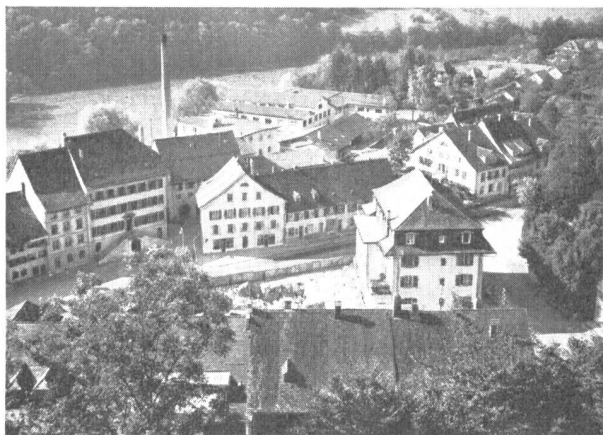
Abb. 4. Blick vom Schloss auf die bereits ausgehobene Baugrube. (Aufnahme Gmünder, Aarburg.)

schutz verbesserte das Projekt mit Erfolg, wobei er allerdings die Nachteile, die sich aus der zu starken Ausnützung des Grundstückes ergaben, nicht restlos zu beseitigen vermochte. Der rührige Verkehrs- und Verschönerungsverein unternahm unter Führung von Architekt G. Keller erneut den Versuch, die Ge-