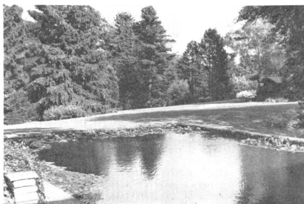
Oben: Flugaufnahme über einen Teil des Areals der beiden durch die Stadt Aarau neu erworbenen Landsitze. — Mitte und unten: Ausschnitte aus der prachtvollen Parkanlage des neuen Besitztums.