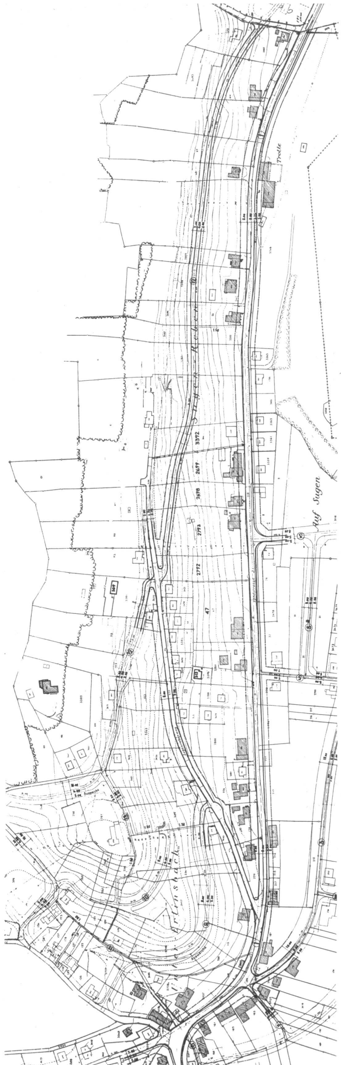
Abb. 1 und 2. Oben Situationsplan des «Sugenreben»-Hanges mit alter Ueberbauung (Stand zirka 1930) und einkizzierten Erschliessungsweg parallel zur Landstrasse. Bei Projektierung dieser zweckmässigsten Lösung wäre der Weg wohl noch einige Meter hangaufwärts verschoben worden. Unten der genehmigte Ueberbauungsplan. Die mit dem Ausbau des Sugonrebenweges (von der Landstrasse abzweigenden Flurweg) einsetzende wahllose Ueberbauung verhinderte eine zweckmässige Erschliessung des Hanges.