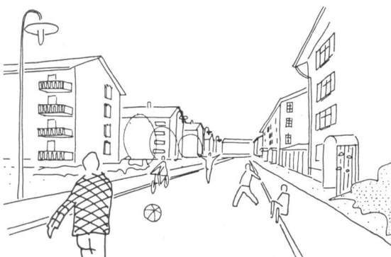
Heute irgendwo in der Schweiz

Unsere heutigen Stadterweiterungen zeigen oft ein trostloses Bild. Mietsblock reiht sich an Mietsblock, oder planlos entstehen hier und dort einige Einfamilienhäuschen in der Landschaft. Bei den grossen Bauvolumen, die Jahr für Jahr neu gebaut werden, können wir uns auf die Dauer eine so planlose und landzerstückelnde Bebauung nicht leisten. Wir müssen wieder dazu kommen, unsere Siedlungen als organische Einheiten zu entwickeln, konzentriert und landsparend zu bauen und den Städtebau zu neuer Gestaltung und Lebendigkeit erwecken. Nur so wird es möglich sein, die Landschaft nicht ungebührlich zu entstellen und das Wechselspiel zwischen geschlossener Siedlung und freier Natur zu erhalten. An Stelle einer zerfranst Landschaft, die weder Stadt ist noch Land, werden die gestaltete Siedlung und das freie Land treten müssen. Das Beispiel von «Neu-Zofingen» ist nur eine von vielen Möglichkeiten. Es will nicht Anspruch erheben, endgültig zu sein, auch ist die äussere Form ganz sekundär. Entscheidend ist der Inhalt: für unser Land und den heutigen Menschen die sozial richtige Wohnform zu finden.