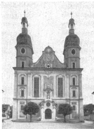
Oberes Bild: Heutiger Zustand, das Ergebnis einer gutgemeinten „Renovierung“ aus dem letzten Jahrhundert.