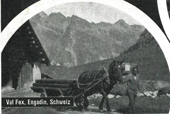
Val Fex, Engadin, Schweiz