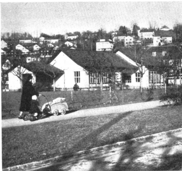
Abb. 2. Im Vordergrund Strasse und Gehweg, im Hintergrund das Kindergartengebäude.