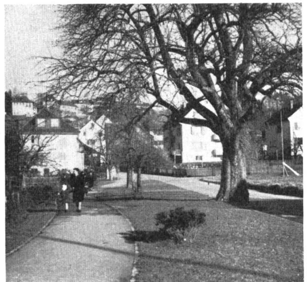
Abb. 3. Blick auf Gehweg und Grünstreifen mit altem Baumbestand.