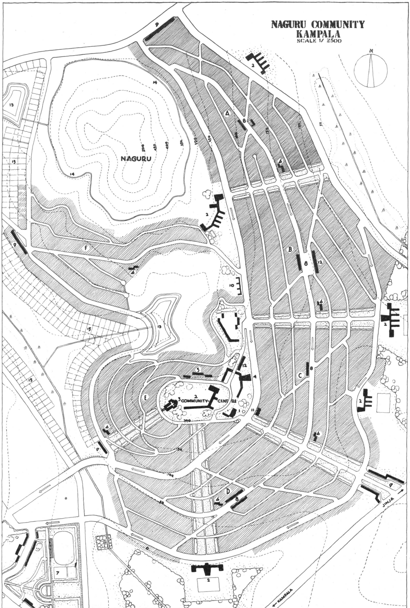
Abb 2. Bebauungsplan für die Afrikanerstadt Naguru, die auf einem der Hügel Kampalas geplant ist.