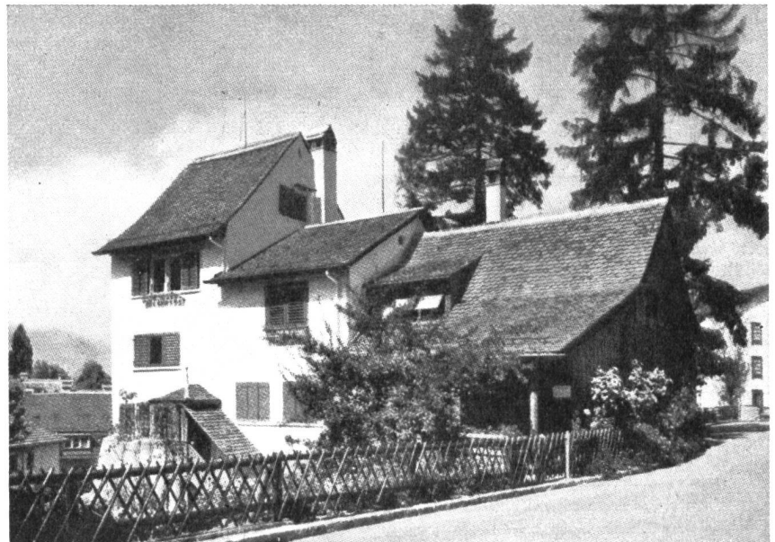
Abb. 2. Ein ähnliches Spielzeug, diesmal des «Heimatschutzes» und der subventionierenden Behörden, ist das renovierte Haus «zu den drei Tannen» in Zürich-Enge. Es darf schliesslich jeder sich amüsieren, wie er will. Man darf nur nicht verlangen, dass solche historisierende Liebhabereien als ernsthafte Beiträge zur Städteerneuerung aufgefasst werden sollen.