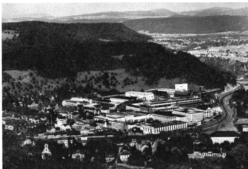
Abb. 2. Die Fabrikanlage der Firma Brown Boveri im Industrieort Baden. Heutiger Bauzustand.