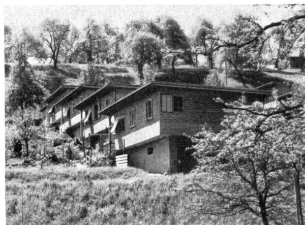
Abb. 2. Ausgeführte Siedlung in der Art des «neuen Bauens».

Zum Schluss fasste der Redner seine Stellungnahme in sechs Thesen zusammen, die wir hier im Wortlaut wiedergeben: