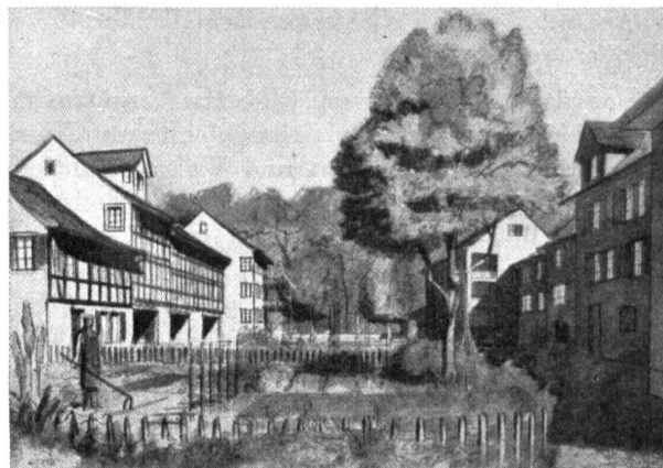
Abb. 1. Siedlungsprojekt im «Dörflistil».

Für die Auswahl der Wohnungstypen bilden die Wohnstatistiken der einzelnen Gemeinden sowie die Untersuchungen des kantonalen Statistischen Amtes eine wichtige Grundlage, und es gelang dem Referenten, diese in sehr anschaulicher Weise in Wort und Bild darzustellen und auszuwerten. Noch immer wird aus Rendite-Gründen das Mehrfamilienhaus bevorzugt; keine der Gemeinden weist heute das vom Referenten aufgestellte Idealverhältnis von 50 % Einfamilienhäusern auf. Zollikon 39 %, Kilchberg 26 %, Richterswil nur 16 %. Es muss darum vor allem auch für einfache Verhältnisse der Einfamilienhausbau mit allen Mitteln unterstützt werden. Ein Haustypus fehlt fast ganz unter den Neubauten am Zürichsee, und das ist das Einfamilien-Reihenhaus, obwohl es in Form der quer zum Hang gestellten Reihe seit Jahrhunderten dort heimisch ist. Es war interessant, zu vernehmen, dass der Kanton Zürich für die Erleichterung der Finanzierung einfacher Einfamilienhäuser für kinderreiche Familien, und insbesondere für Reihen-Einfamilienhäuser , zinslose, in kleinen Raten rückzahlbare Darlehen zur Verfügung stellt, sofern die Gemeinde eine ungefähr gleichwertige, zusätzliche Unterstützung gewährt.