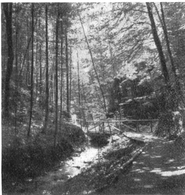
Abb. 2. Das Heslibacher-Tobel bei Küsnacht in seinem unteren Teil sorgfältig gepflegt, durch einen schön angelegten Spazierweg erschlossen.