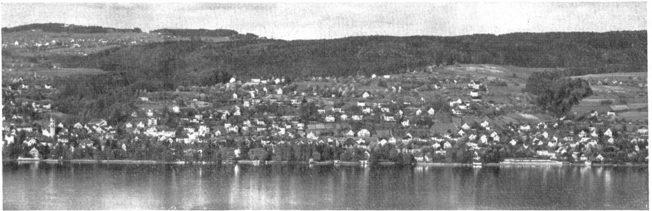
Abb. 1. Der landschaftliche Charakter der Zürichseehänge wird bestimmt durch die bewaldeten Tobel, die die bebauten Hangflächen in bestimmten Abständen unterbrechen und so das Grün der bewaldeten Höhen an den See hinunter ziehen. Diese Tobel bilden ein wichtiges Erholungsgebiet für die Bevölkerung, wenn sie auch für die anstossenden Landbesitzer und die Strassenbauer nur ein unliebsames Hindernis bedeuten. Daher kommt die sich widersprechende Behandlung gegenüber diesen Landschaftspartien, wie dies nachfolgendes Beispiel zeigt. Die Notwendigkeit eines einheitlichen Vorgehens auf Grund einer durchgehenden Planung steht hier ausser Zweifel.

Ein wichtiges Gebiet der Regionalplanung ist der Landschaftsschutz, d. h. die Schaffung von zusammenhängenden Zonen, die mit Baubeschränkungen belegt sind, damit neben der Siedelung die offene Landschaft erhalten bleibt. Diese Landschaftspartien müssen nicht nur unter Schutz gestellt, sie sollen auch unterhalten und durch Wanderwege erschlossen werden. Als Beispiel wird ein Ausschnitt aus der Zürichseelandschaft herausgegriffen.