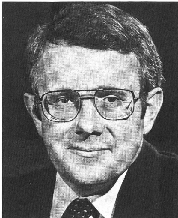
Arnold Koller

Arnold Koller: Geboren 29. August 1933, von Gossau und Oberbüren (SG) — Prof. Dr. iur. et lic. oec. — Professor und Direktor am Institut für europäisches und internationales Wirtschafts- und Sozialrecht an der Hochschule St. Gallen — Nationalrat — 1986 Bundesrat.