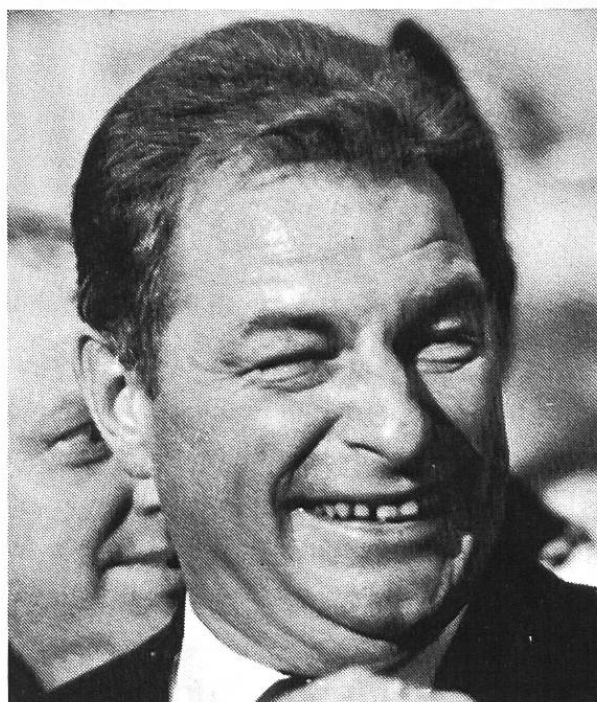
Jean-Pascal Delamuraz (EVD)

Schutz und Förderung von Industrie, Handel, Gewerbe, Landwirtschaft, Aussenhandel — Aufsicht über Veterinärwesen, wirtschaftliche Kriegsvorsorge, Konjunkturfragen, Wohnungswesen.