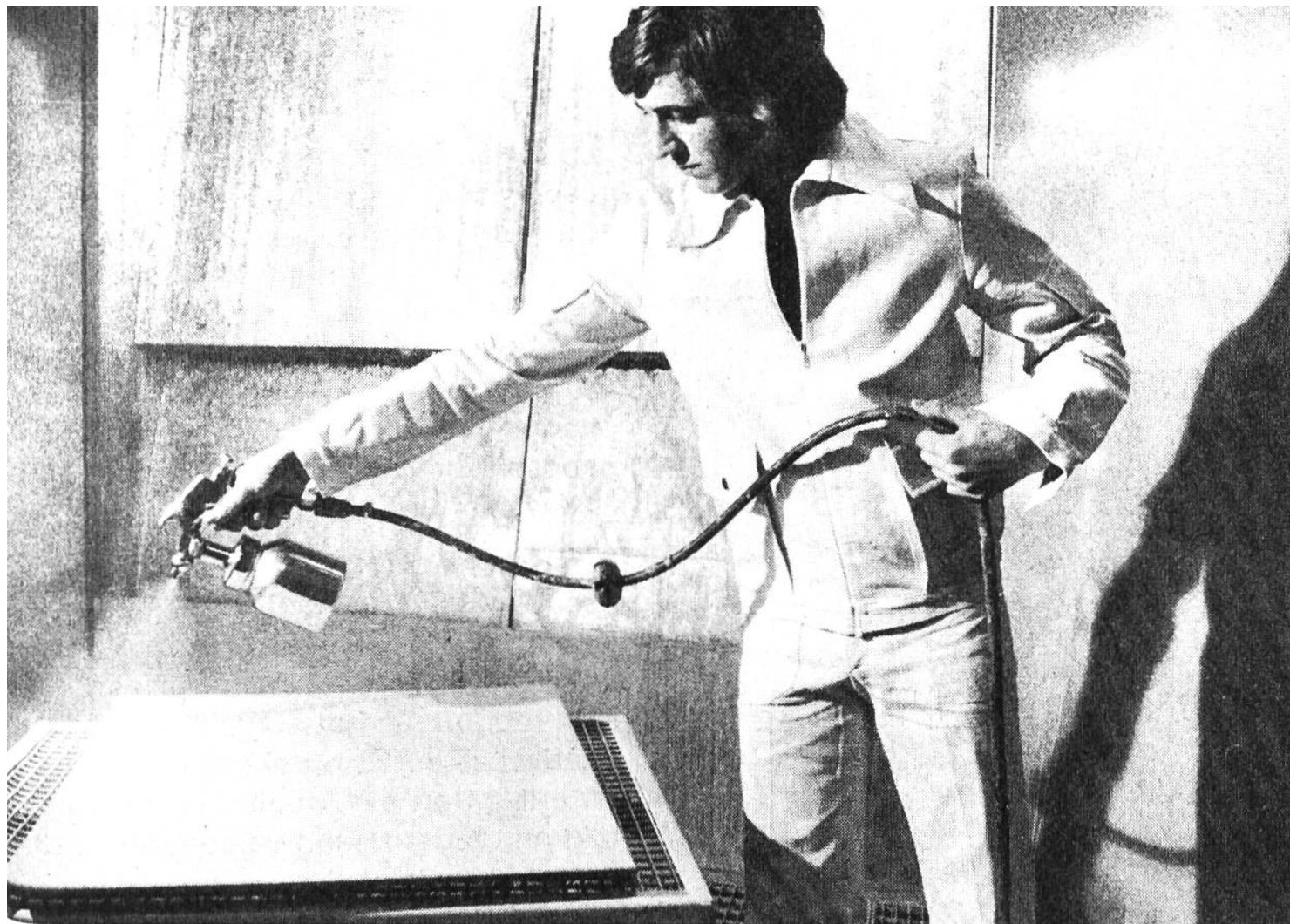
... heikler und feinhandwerklicher Spritzarbeit in der Werkstatt.

Arbeitsgebiet: Anstreichen, Beschichten und Behandeln von Oberflächen der Innen- und Aussenwände, Decken, Böden, Türen, Fenster, Installationseinrichtungen wie Leitungen und Heizkörper, Holz- und Metallkonstruktionen, Möbel, Gegenstände aller Art aus Industrie, Handwerk und Verkehr; Aufziehen von Geweben aller Art als Bespannungen, Tapeten und Kunststofffolien auf Wänden.