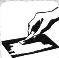
sauber verstreichen mit Spachtel