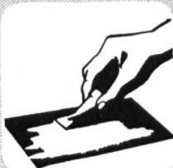
sauber verstreichen mit Spachtel