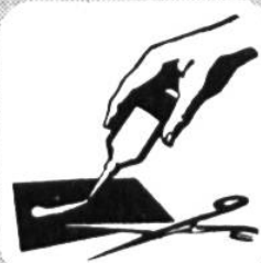
sauber auftragen mit Streichdüse

Konstruvit klebt Papier, Karton, Holz, Leder, Gewebe, Metall- oder Azetatfolien, Kunstleder, Schaumstoff, Acrylglas, usw. auf Holz, Papier, Karton, Gips, Glas usw.