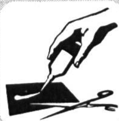
sauber auftragen mit Streichdüse

Konstruvit klebt Papier, Karton, Holz, Leder, Gewebe, Metall- oder Azetatfolien, Kunstleder, Schaumstoff, Acrylglas, usw. auf Holz, Papier, Karton, Gips, Glas usw.