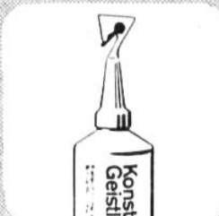
aufhängen am Verschluss-Haken