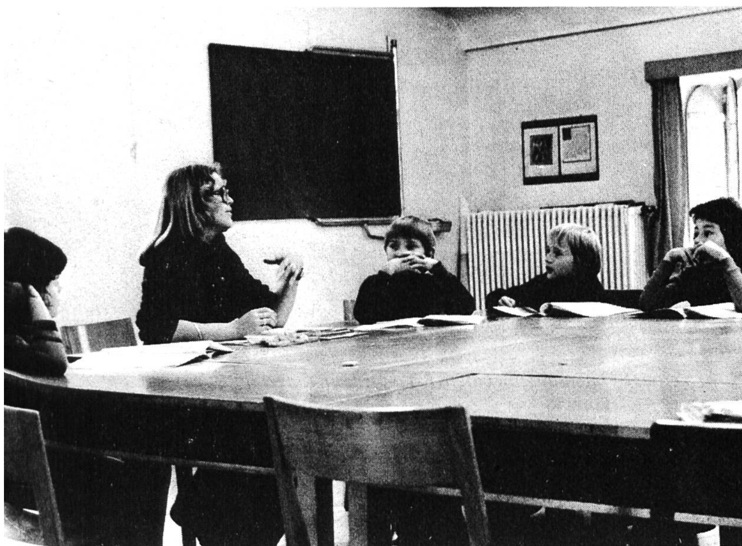
Eine Gruppe der Jüngeren macht sich mit dem musikalischen ABC vertraut.