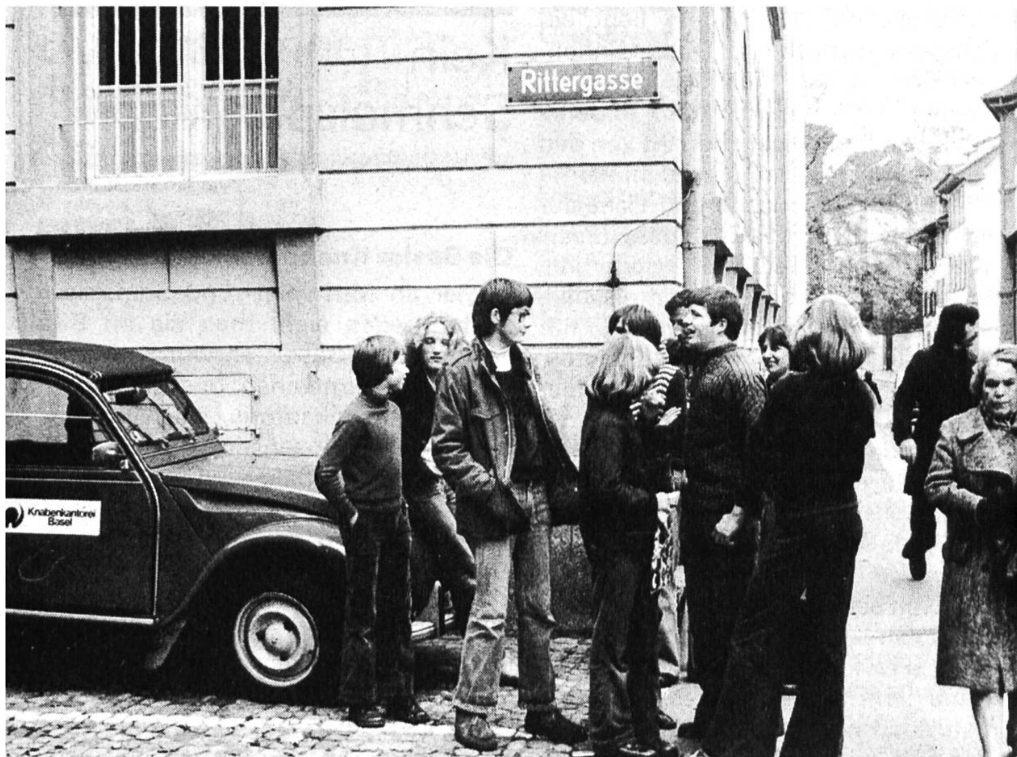
Vor dem Bischofshof versammeln sich die Knaben der Kantorei am Mittwoch- und am Samstagnachmittag

Wenn ein achtjähriger Knabe in die Kantorei eintreten will, wird er zuerst auf seine stimmliche und musikalische Eignung hin geprüft. Dann macht er einen Grundkurs, in dem er von erfahrenen Lehrern in Rhythmik, Melodik, Stimm- und Gehörbildung geschult wird. Je nach Begabung wechseln die Buben früher oder später (spätestens nach zwei Jahren) ins sogenannte Chorhospitium über, das heisst, sie werden im Chor mit der Kunst des Chorsingens vertraut gemacht. Endlich kommt der grosse Tag: