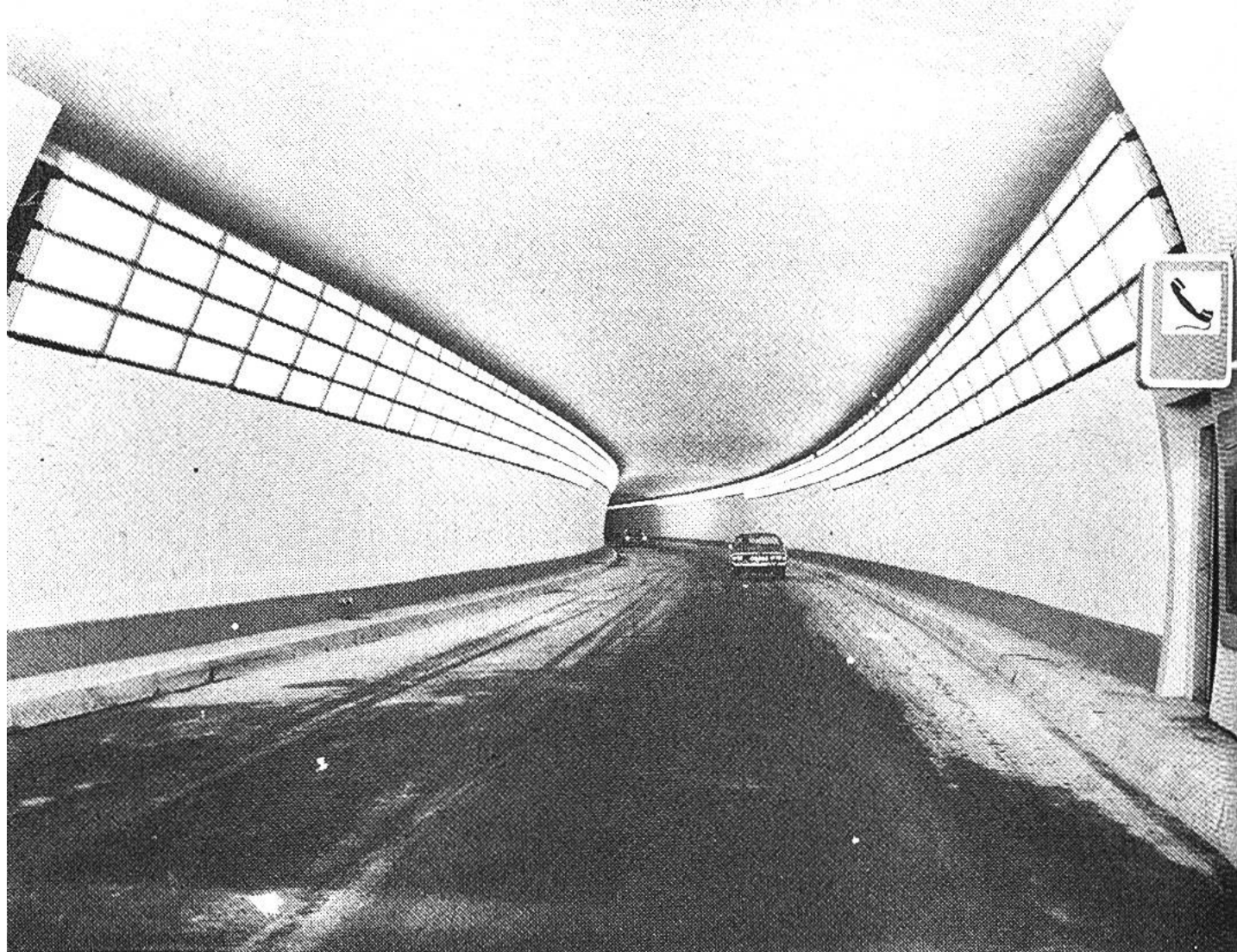
Nördliche Tunneleinfahrt am San Bernardino.

Reichenau, wo Vorder- und Hinterrhein zusammenfliessen. Im Domleschg erheben sich stolz 20 Burgen und Schlösser, sie berichten von einer reichen Vergangenheit. Cazis und Thusis sind weitere Orte vor den kühnen Brücken in der einst gefürchteten Via Mala. In Zillis steht die weltberühmte Martinskirche mit ihren prachtvollen Deckenbildern. Über Andeer geht's durchs Rheinwald nach Splügen und zum Nordportal des Tunnels, von hier aus sind noch die vielen Kehren sichtbar, die zur Passhöhe hinaufführen. 6,6 km lang ist der Tunnel, seine Baukosten betrugen rund 150 Millionen Franken; die Strassenbreite beträgt 7,5 m. Das Belüftungssystem gestattet