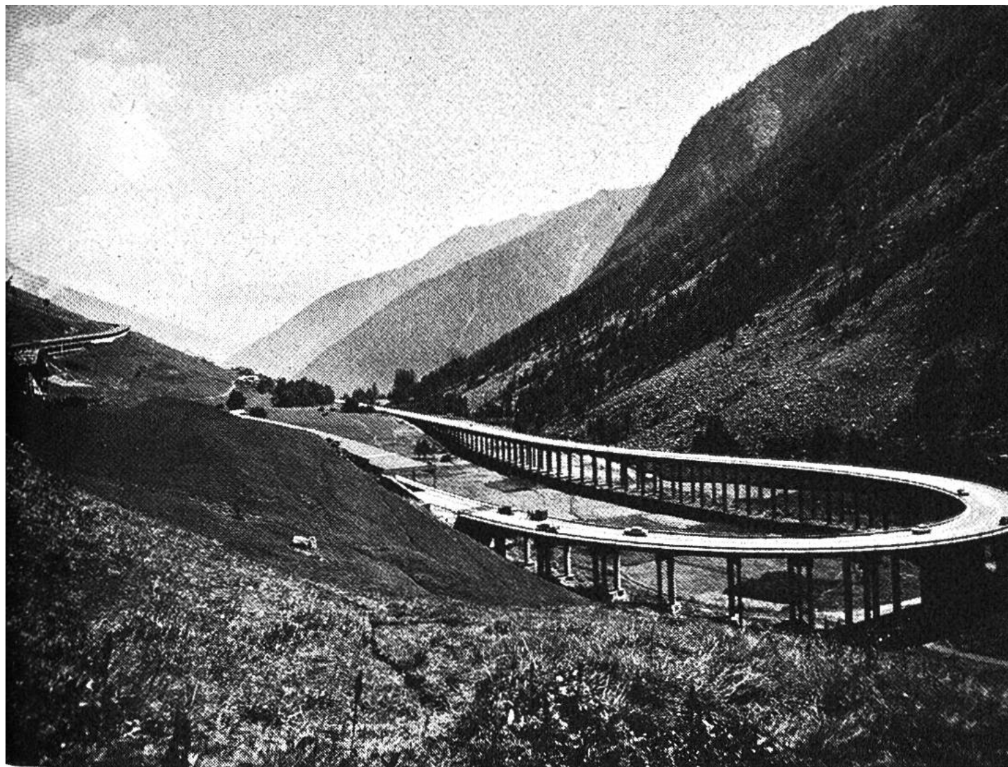
Imposante Strassenführung auf der italienischen Seite des Tunnels am Grossen St. Bernhard.

Dank internationalen Abmachungen können die schweizerischen und italienischen Zollformalitäten am Tunneleingang erledigt werden, am Ausgang hat dann jedes Auto freie Fahrt. Eine weitere Nord-Süd-Verbindung, die den früher nur wenige Monate möglichen Passverkehr aufs ganze Jahr ausdehnt, befindet sich rund 170 km im Osten dieses ersten Alpen-Strassentunnels, in den Bündner Bergen. Als erster Alpen-tunnel des schweizerischen Nationalstrassennetzes wurde Ende 1967 der San-Bernardino-Tunnel eröffnet. Mit dem Ausbau der Strasse zwischen Chur und Bellinzona sind zwei Schweizer Landesteile einander näher gerückt und können rascher und bequemer erreicht werden.