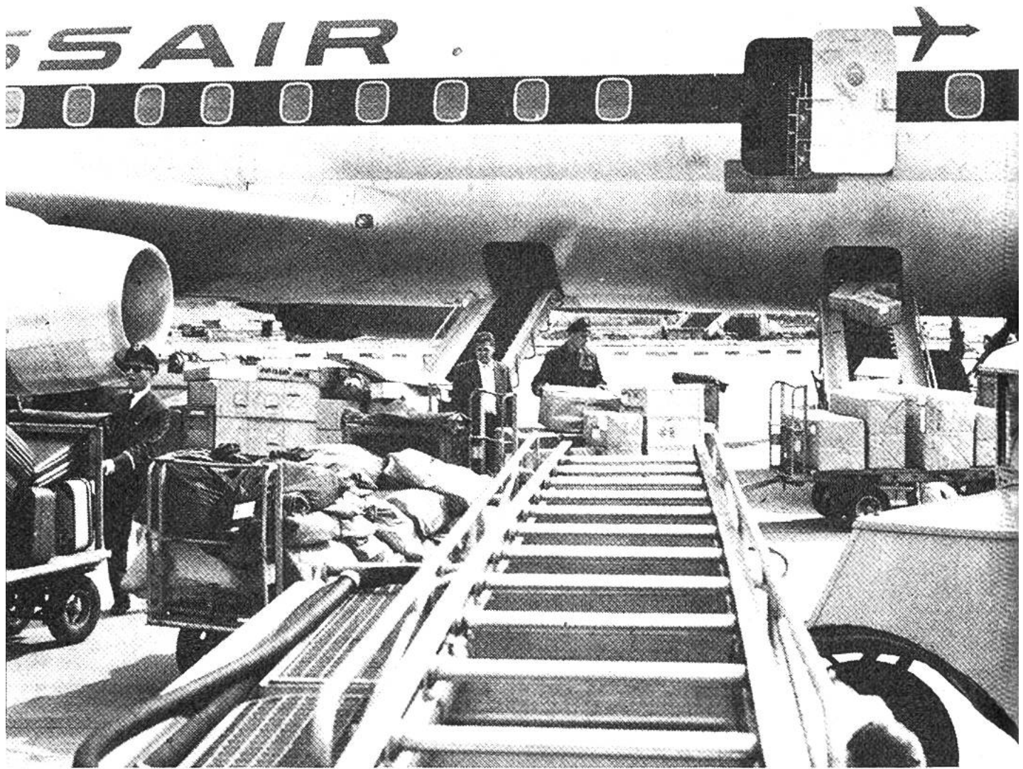
Ausladen von Frachtsendungen und Passagiergepäck.

dort Abnehmer für seine Edelsteine zu finden. Aus Bangkok kommend, wartet eine Frau auf ihren nächsten Anschluss nach Paris. Sie will sich die neuen Modedesigns ansehen. London ist das Ziel des Geschäftsmannes aus Japan, der dort Börsengeschäfte zu erledigen hat. Eine Gruppe Touristen aus Hamburg wartet auf ihren Weiterflug nach Afrika. Sie wollen den Serengeti National Park in Tansania besuchen. Alle diese Passagiere reisen durch die Schweiz dank unserer geographischen Lage – im Herzen Europas.