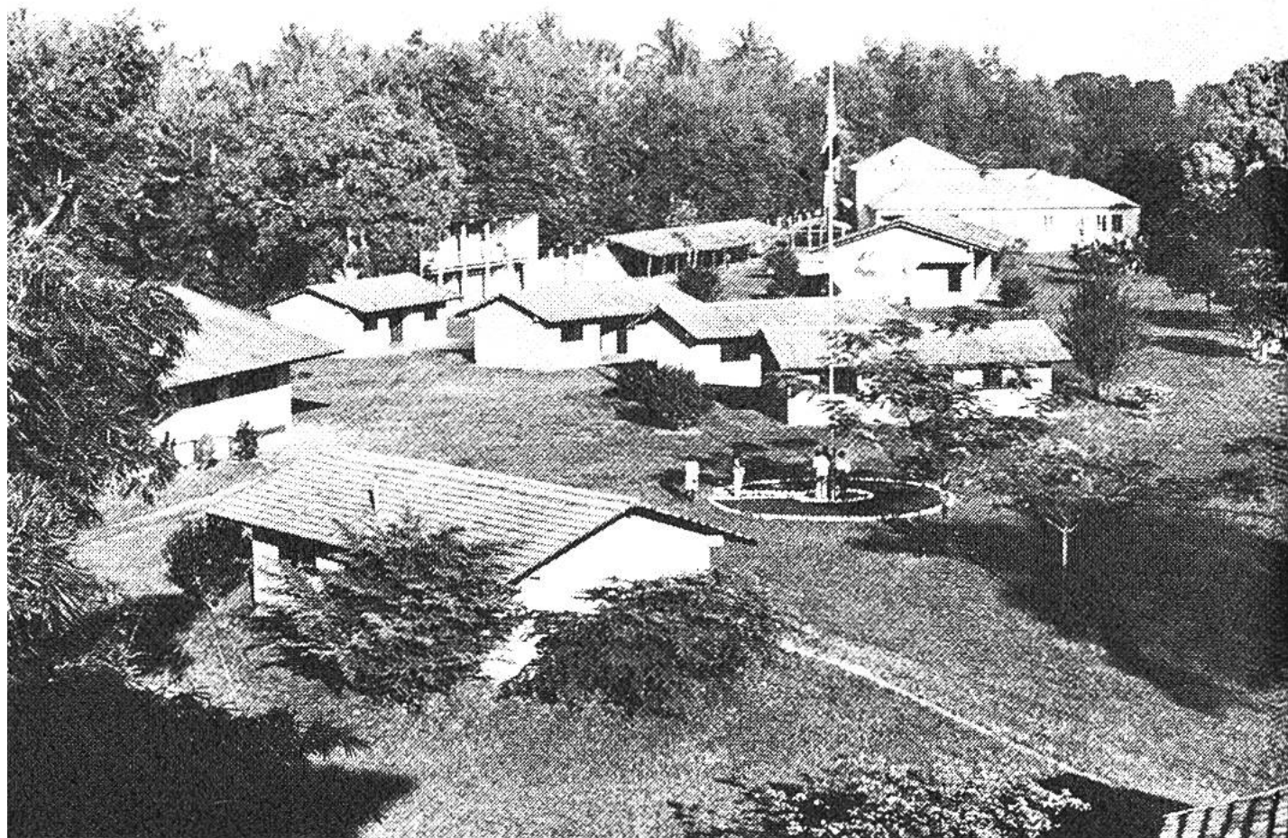
Die Arbeitsstätte des Schweizerischen Tropeninstituts in Ifakara (Tanganjika).

tropen darstellen und teilweise junge Mediziner auf ein ärztliches Wirken in Übersee ausbilden. Die allgemeinen Tropenkurse sind für Auswanderer und Reisende nach tropischen und subtropischen Zonen bestimmt. Es werden geographische, kulturelle, medizinische, hygienische, biologische und historische Kenntnisse vermittelt. In der Tropenschule erfolgt in einjährigen Spezialkursen Unterricht für zukünftige Tropenagronomen (Ackerbaukundige) und Zuckerchemiker für eine spätere Tätigkeit in Übersee.