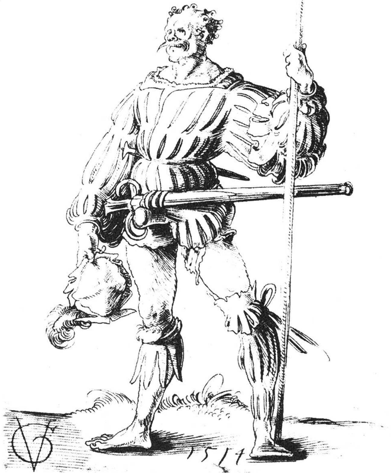
Schweizer Söldner in voller Kampfausrüstung zur Zeit der Mailänder Feldzüge, von Urs Graf um 1514 in einer Federzeichnung festgehalten.

grosser Teil unserer Jugend. Wie bedeutend das Reislafen noch im 18. Jahrhundert war, mögen folgende Zahlen veranschaulichen: Um 1750 befanden sich rund 78 500 Mann in fremdem Solddienst. In Frankreich standen 20 100, in Holland