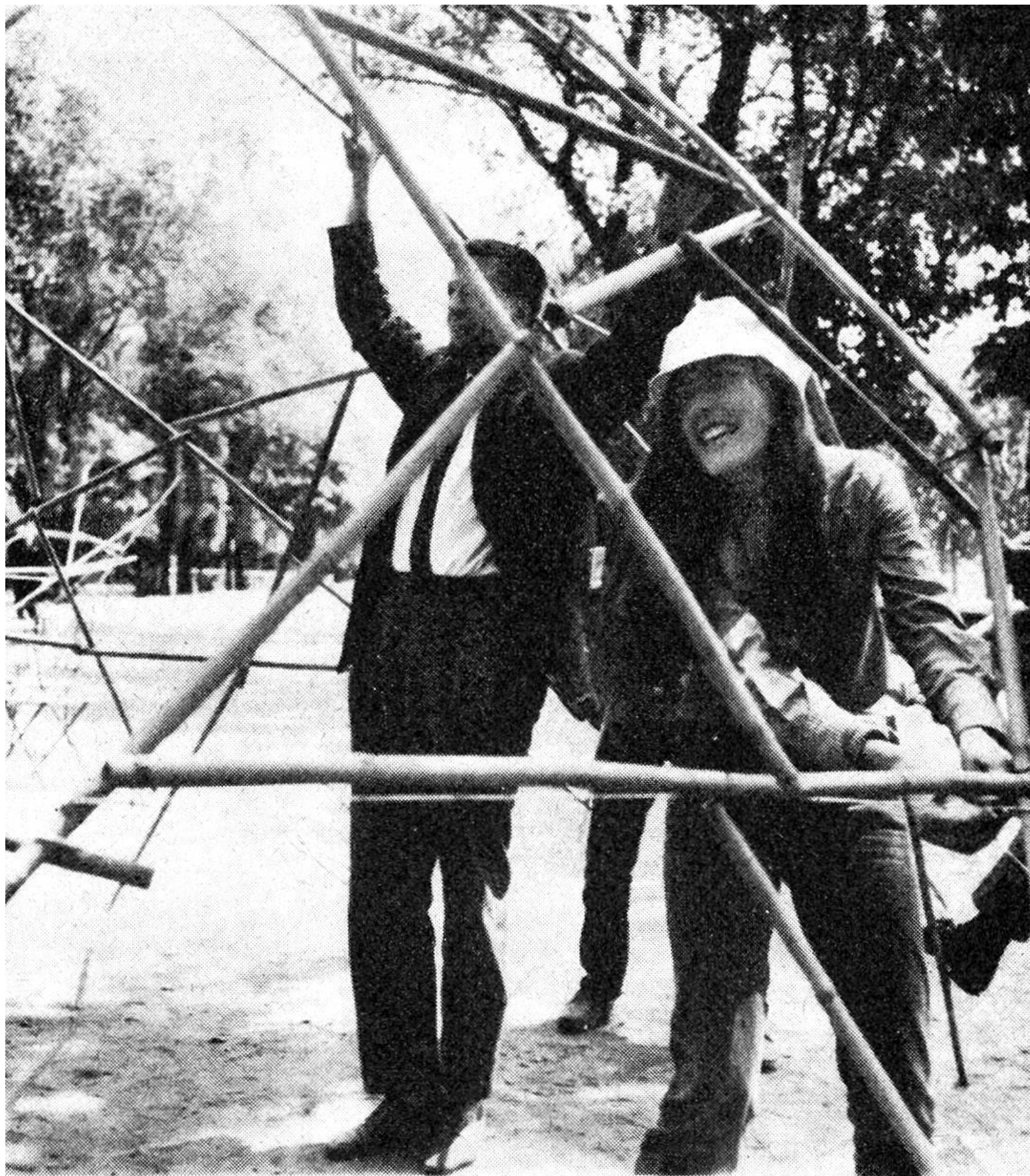
Junge Architekturstudenten zeigen in einer Ausstellung neue Baumöglichkeiten.