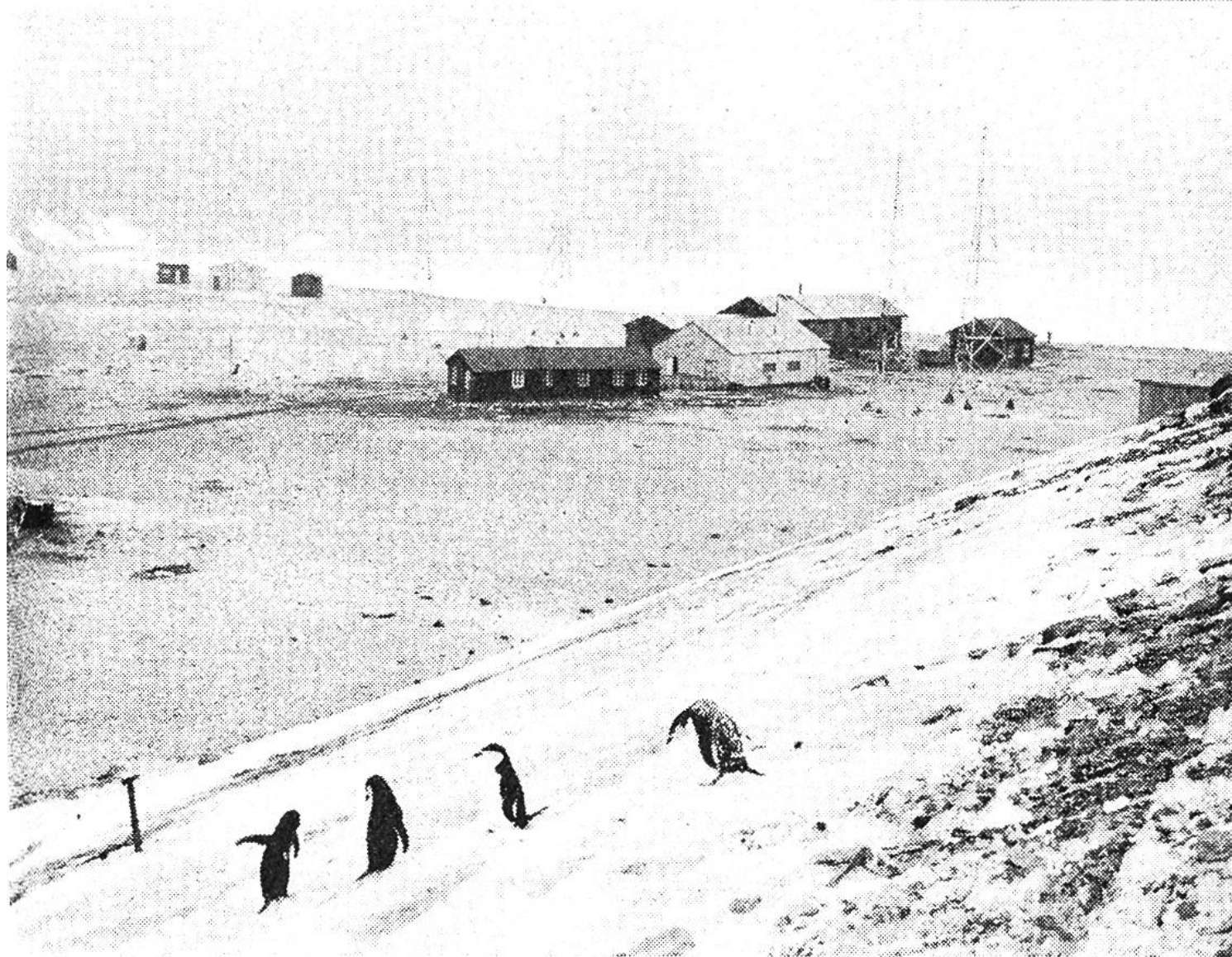
Forschungsstation auf dem eisfreien Teil (total 2500 km 2 ) der Antarktis. In dieser einsamen Landschaft spielen Pinguine die Rolle der Zaungäste.

hatten immer noch erst eine kleine Anzahl Menschen die endlose Eiswüste betreten, und in mancher Beziehung wusste man über die Antarktis weniger Bescheid als über die Oberfläche des Mondes! Die neueste Phase der Antarktisforschung ist durch den Grosseinsatz von Menschen, Transportmitteln und Material gekennzeichnet. Im «Internationalen Geophysikalischen Jahr» (IGJ: 1957/58) konzentrierte sich die wissenschaftliche Forschung vieler Nationen auf die Entschleierung der Antarktis. Unter gewaltigem Materialeinsatz starteten vor allem die USA verschiedene Grossunternehmen, so zum Beispiel das Unternehmen «Deepfreeze» (1956), dem drei Eisbrecher, drei Frachtschiffe, drei Tanker, zwölf Flugzeuge und neun Hubschrauber