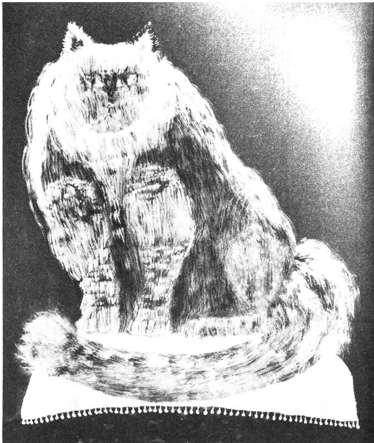
Mein Traum-Angorakater. Von Christoph Kienzle (12 Jahre), Basel.