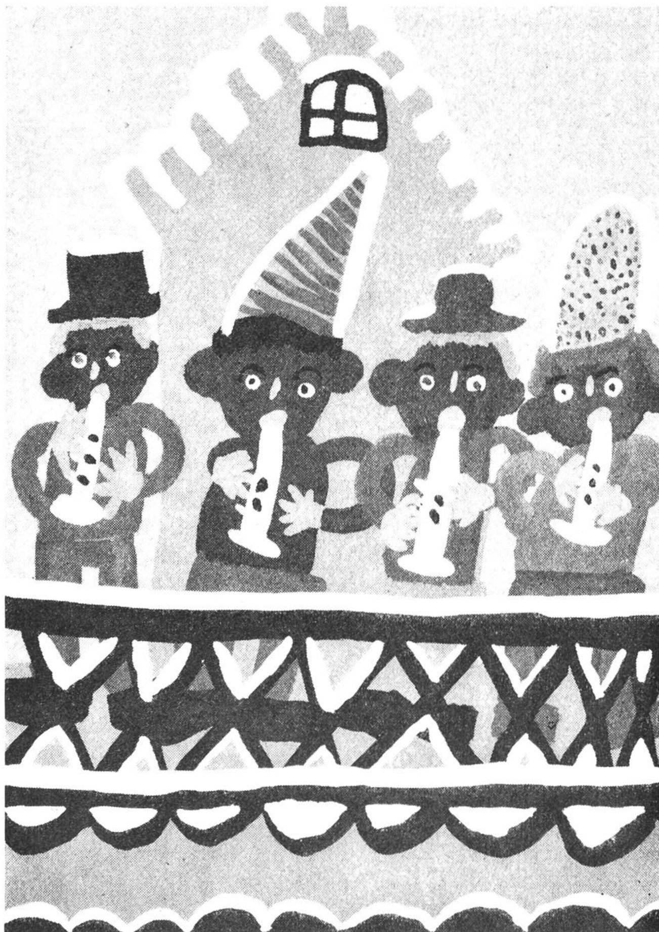
Die Posaunenbläser auf dem Münsterturm in Basel während der Weihnachtszeit. Von Fritz Bühler (10 Jahre), Münchenstein.