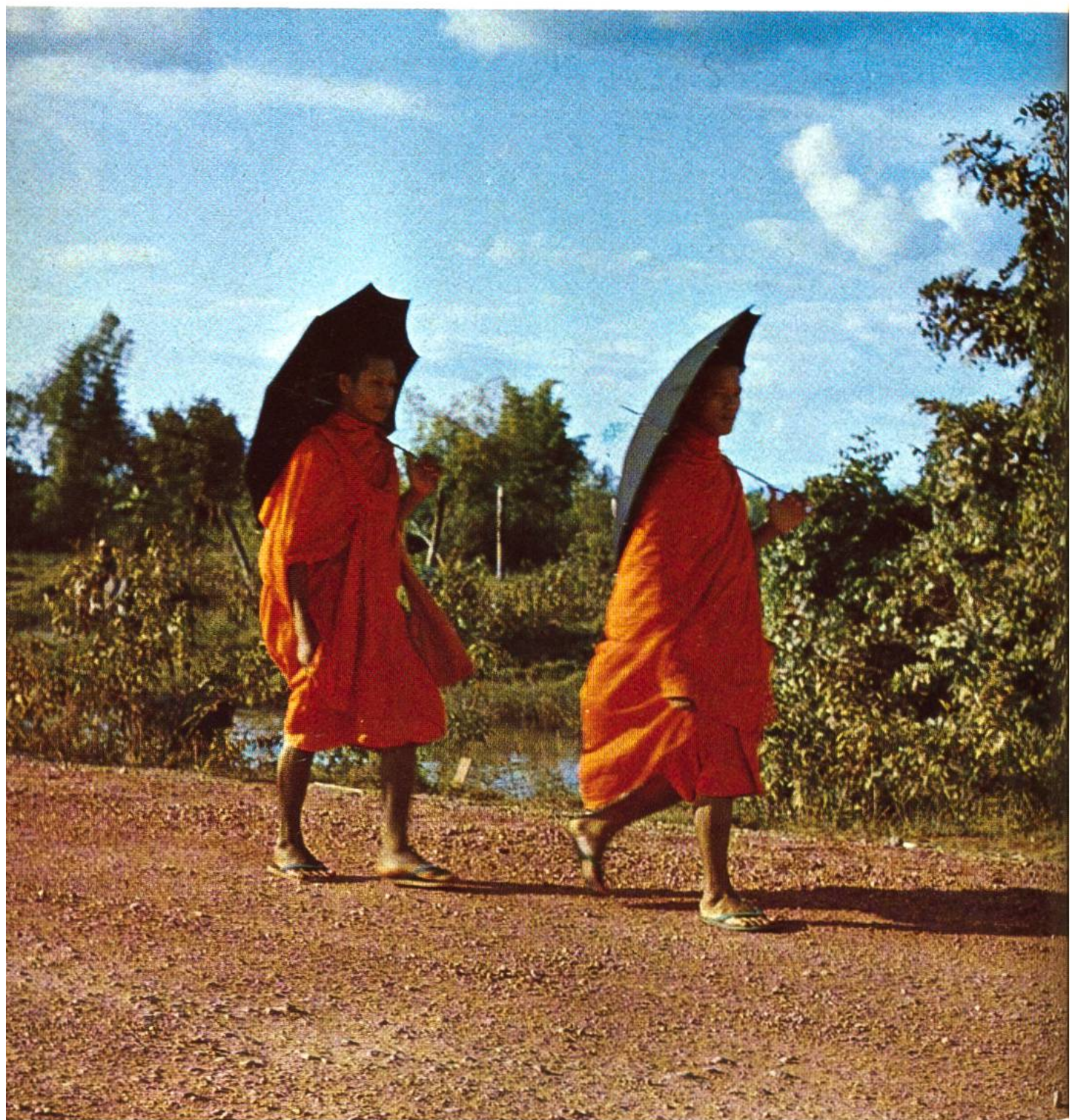
Zwei buddhistische Bettelmönche auf einer Strasse in Thailand. Sie schützen ihren kahlgeschorenen Kopf vor den Sonnenstrahlen. Die Mönche leben von den freiwilligen Gaben ihrer Mitbürger.