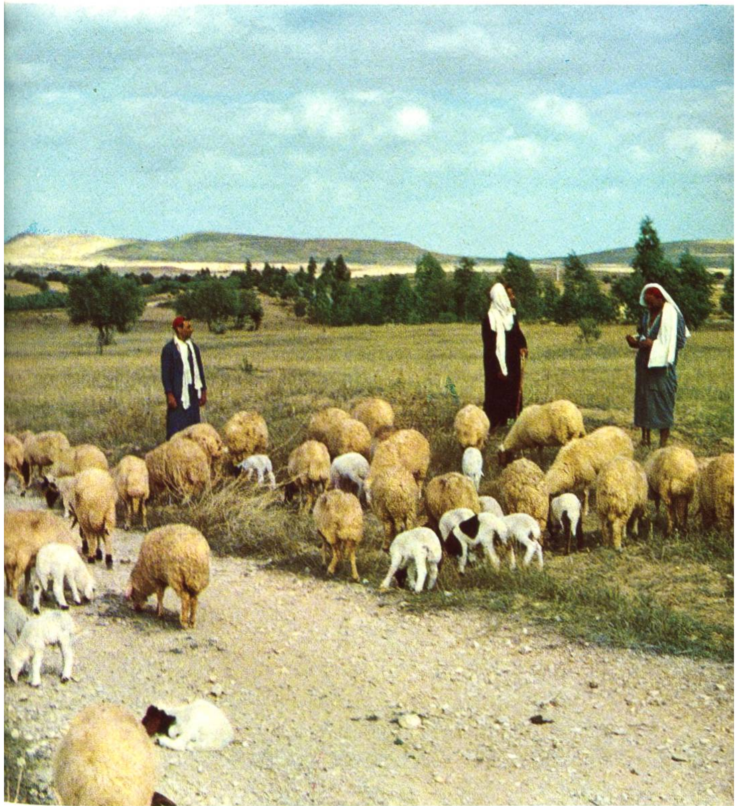
Wie ein Bild aus biblischer Zeit mutet es an, wenn die Nomaden in der mitteltunesischen Steppe ihre Schafherden auf die Weide treiben.