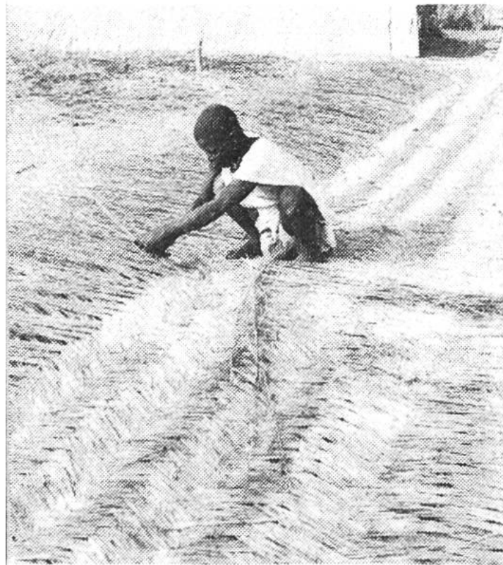
Mit grosser Handfertigkeit flechten die Einheimischen das Elefantengras zu Matten.