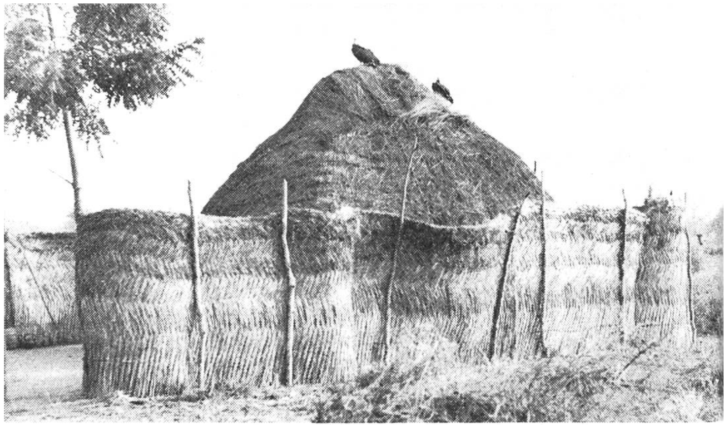
Die «Graswände» sollen den Wind und die Sandstürme abhalten.