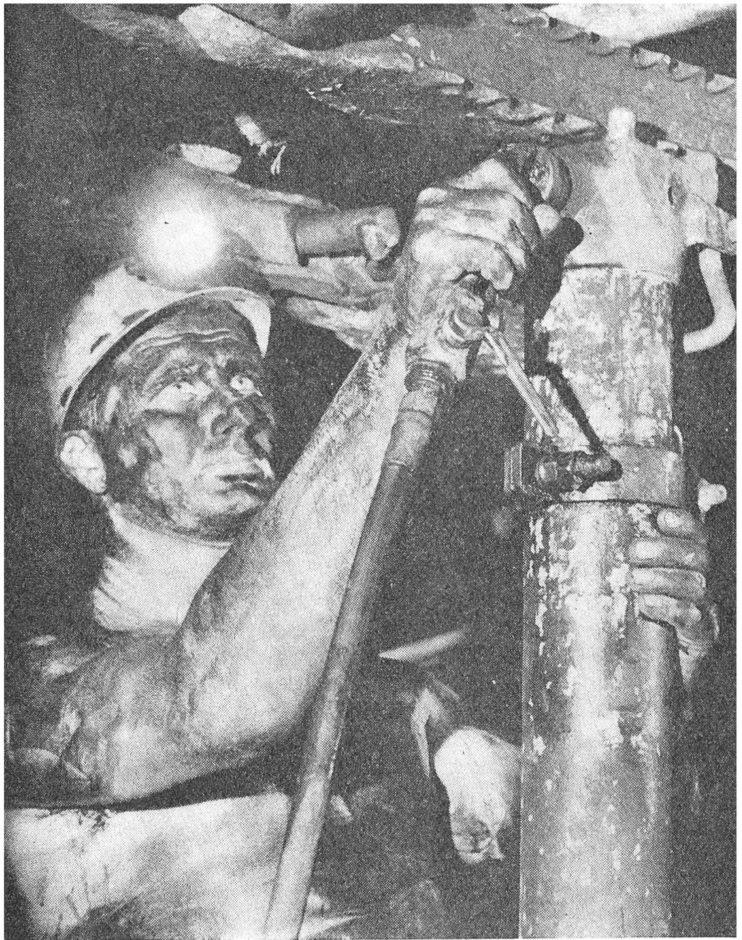
Ganz besondere Aufmerksamkeit muss der Abstützung der Stollendecken geschenkt werden. Hier passt ein kohlungeschwärzter Bergmann einen Stempel (Stützpfehl) ein.