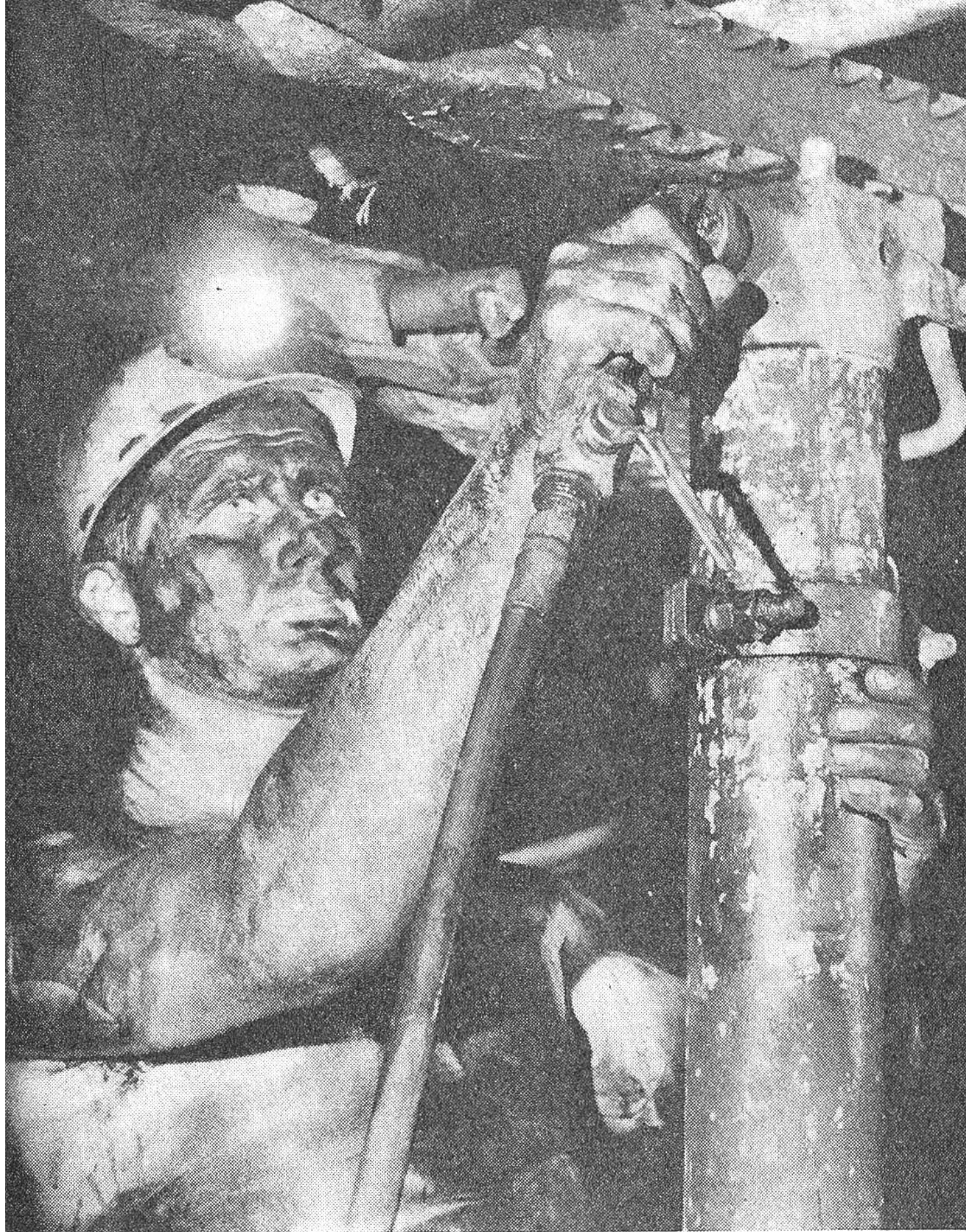
Ganz besondere Aufmerksamkeit muss der Abstützung der Stollendecken geschenkt werden. Hier passt ein kohlungeschwärzter Bergmann einen Stempel (Stützpfehl) ein.