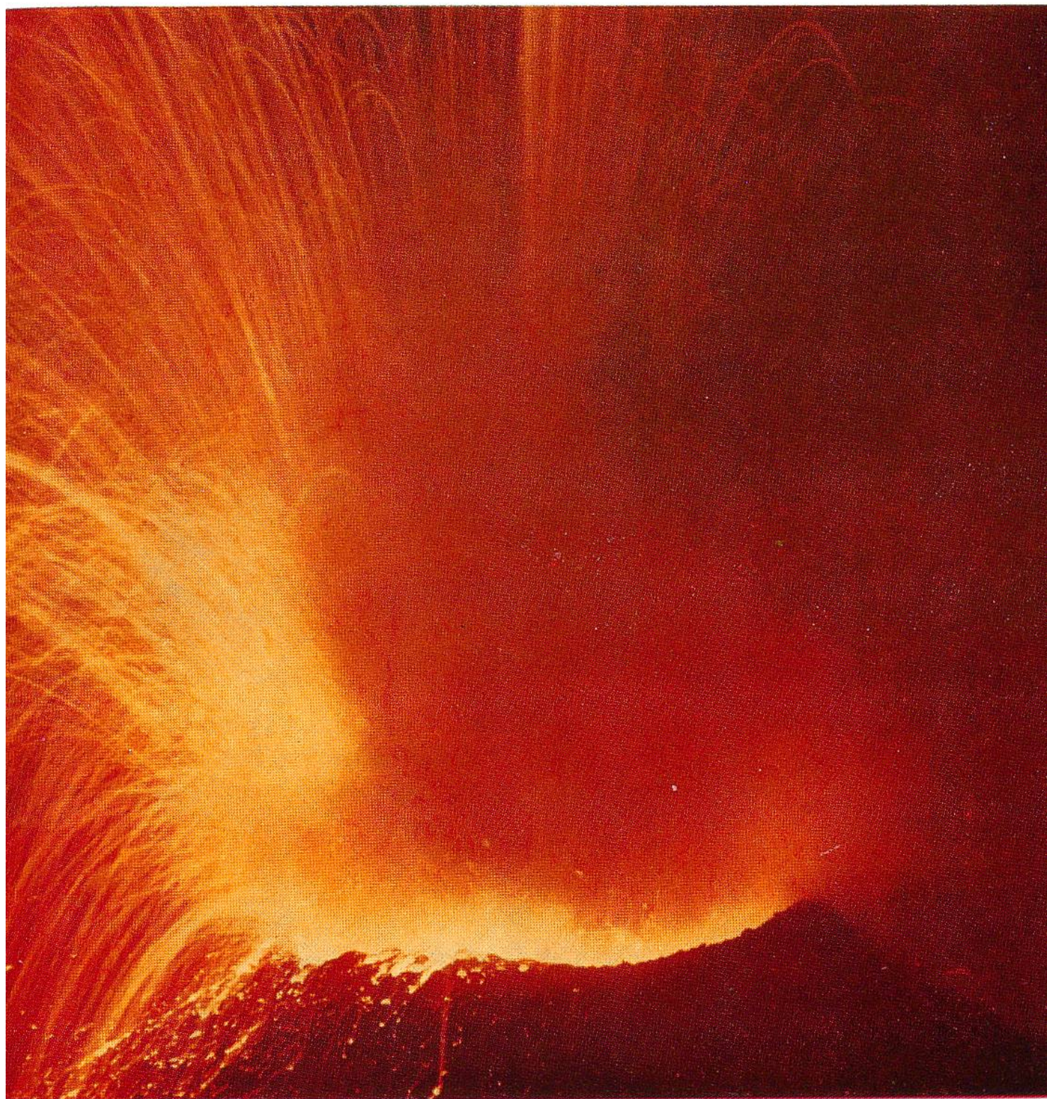
Vulkanische Explosion im Krater des Stromboli. Aufnahme bei Morgendämmerung.