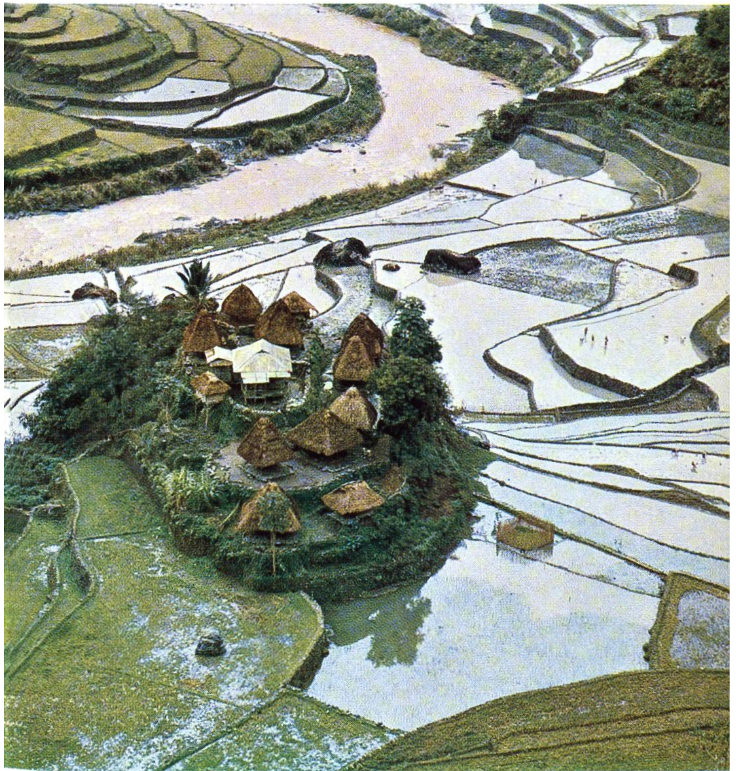
Wie eine Insel liegt die kleine Bauernsiedlung zwischen den wasserüberfluteten Reisterrassen auf den Philippinen.