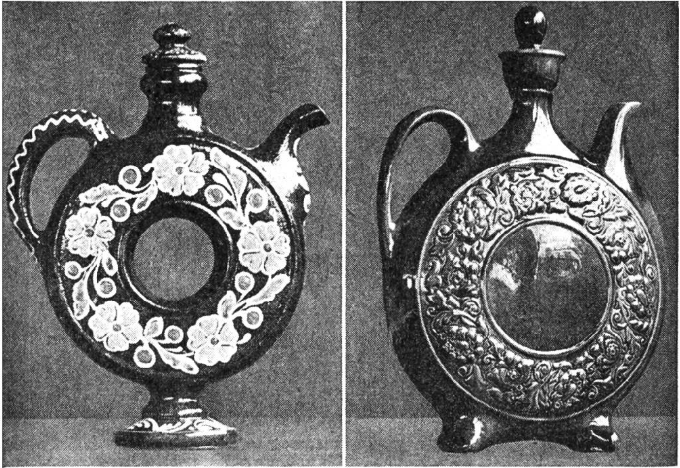
Weinkrüge aus der Ukraine. Links: in der Mitte durchbrochen und mit typischen Bauernornamenten verziert. Rechts: Tonreliefverzierung; das Ganze meergrün glasiert.

(1300–1450°), so erreicht der Ton die Grenze des Schmelzens, und es entsteht das Porzellan. Die Chinesen konzentrierten sich auf diese Art der Töpferkunst und erlangten eine von keinem Land erreichte Vollendung.