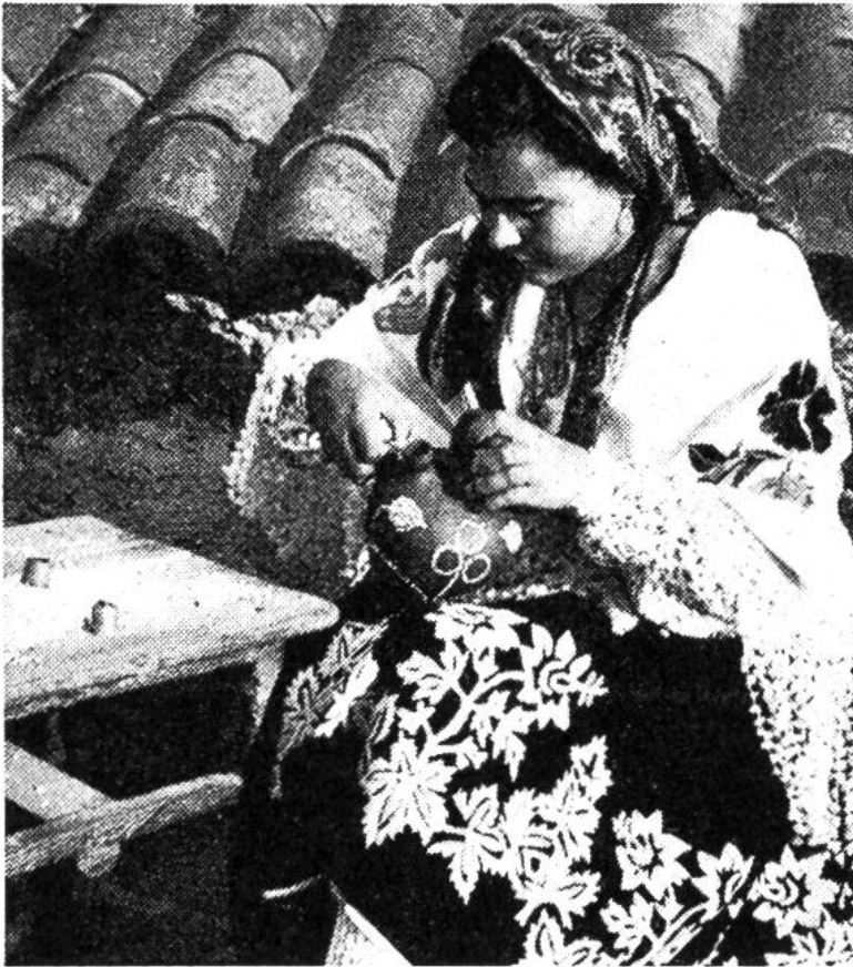
Diese Portugiesin drückt Steinchen um Steinchen in den noch ungebrannten Ton.

Bald begann eine neue Kunst, die Kunst der Verzierung. Mit Holzstäbchen wurden die feuchten Tonformen geritzt, Pflanzenschnüre eingedrückt (Schnurkeramik) oder bandartige Wülste aufgesetzt (Bandkeramik). Aber selbst das Brennen des Tones machte seine Entwicklung durch. Vorerst war es ein offenes Feuer, in dessen Glut die Tonwaren geschichtet wurden. Später überdeckte man alles mit Rasenziegeln, damit die Hitze erhalten blieb. Über Bodenvertiefungen baute man aus gebrannten Ziegeln eine Art Rauchfang, der das Feuer gleichmässig zurückhielt und die Hitze besser ins Brandgut verteilte.