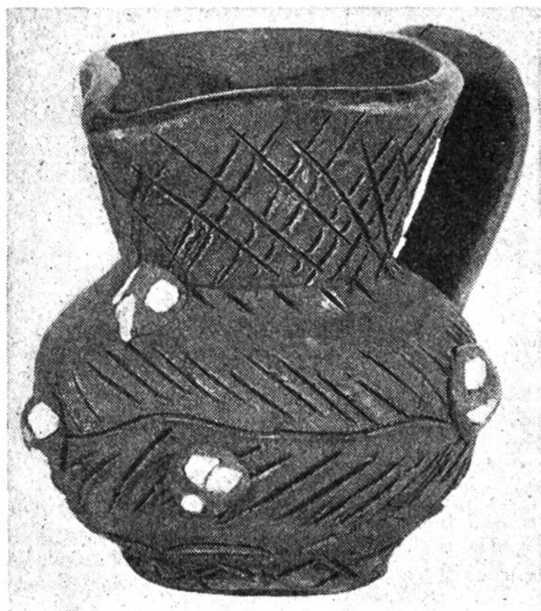
Henkelkrug aus Portugal. In der Gegend südlich des Tejo werden noch heute Tonkrüge mit eingeritzten Mustern ähnlich wie zur Jungsteinzeit hergestellt. Eigenartig sind die Verzierungen mit kleinen Quarzsteinen.