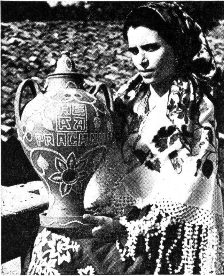
Mit den nach überlieferten Motiven zu Ornamenten und Schriften eingelegten weissen Quarzsteinchen wirkt der fertige Weinkrug recht dekorativ.

geln von grosser Leuchtkraft gefunden. Wie später auch in Ägypten, wurde der Ton im Zweistromland stets glasiert. Die Technik des Glasierens ist nicht einfach. Der Quarzsand ist der glasbildende Stoff. Sein Schmelzpunkt liegt bei 1600^{\circ} . Fügt man Menig und Kaolin bei, so reduziert sich der Schmelzpunkt auf 960^{\circ} . Dank der Farbbeigabe lassen sich wunderbare Farbkombinationen erzielen. Kein Wunder, dass bald Schmuckstücke (Ketten, Ohrringe) aus glasiertem Ton hergestellt wurden. Die Ägypter erreichten eine solche Fertigkeit in der Glasiertechnik, dass sie selbst Steinplastiken glasieren konnten.