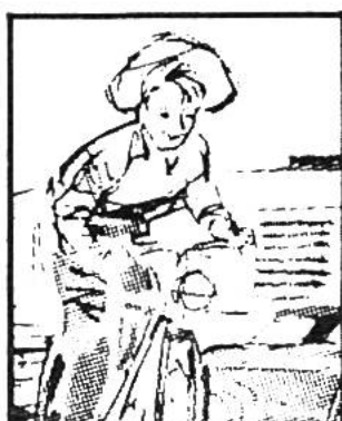
Im Kalender Seite .....