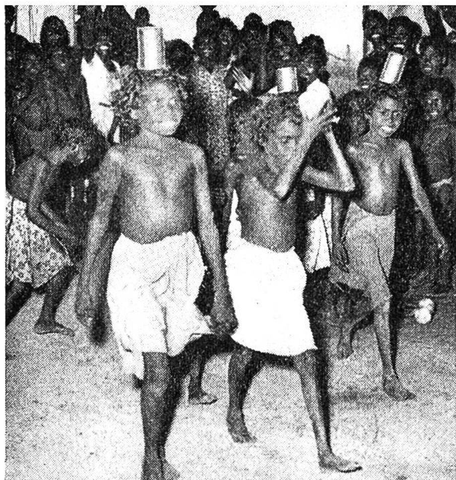
Die Jugend belustigt sich bei einem Wettlauf mit Konservenbüchsen.

vorn gerichteten Dorn versehene Geräte. Zum Werfen legt man den hinteren Teil des Speerschaftes so in die Rille, dass der Dorn in ein Loch am Schaftende passt. Die rechte Hand umfasst den Griff des Speerwerfers und den Speerschaft zugleich. Beim Werfen des Speeres löst man die Finger vom Schaft, hält aber den Werfer weiterhin fest. Dieser wirkt dann als Verlängerung des Armes und verstärkt die Hebelkraft desselben. Noch immer durch den Dorn des Werfers gehalten, kann der Speer mit viel stärkerer Wucht und darum auch viel weiter geschleudert werden, als dies von blosser Hand möglich wäre. Erstaunlich ist es, wie gut die Eingeborenen mit dem sicher schwer zu handhabenden Speerwerfer umzugehen, mit welcher Sicherheit sie damit ihr Wild, Känguruh und Emu vor allem, zu erlegen wissen.