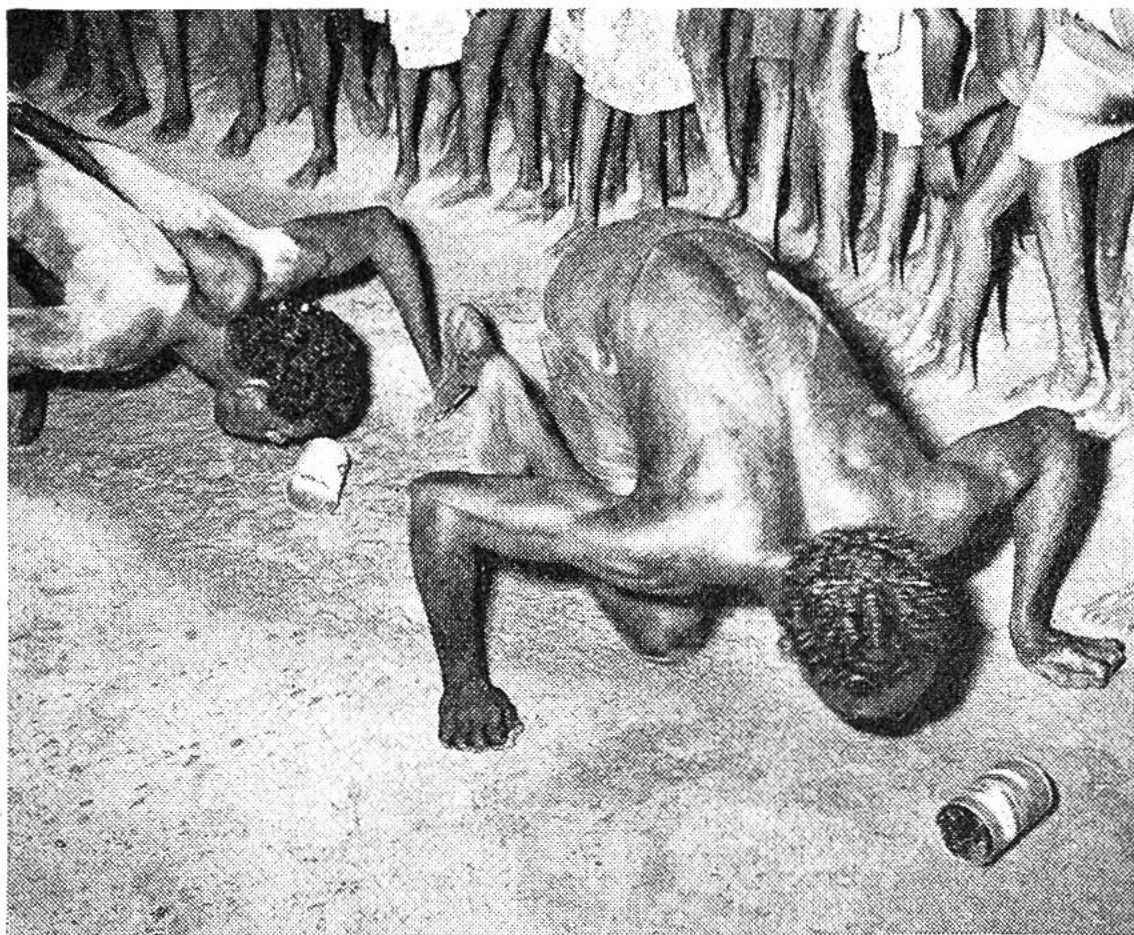
Besondere Geschicklichkeit erfordert das Wettrennen mit Konservenbüchsen, die mit dem Kopf vorwärtsgestossen werden müssen.

Die grossen jährlichen Zusammenkünfte und Feste zum Beispiel haben sie zum guten Teil schon aufgegeben. Mission und Verwaltung bemühen sich, ihnen dafür einen Ersatz zu bieten. So wie man auf den Niederlassungen der Weissen in Schulen und handwerklichen Lehrwerkstätten versucht, sie für ein neues Leben vorzubereiten, so veranstaltet man dort für sie an staatlichen und kirchlichen Feiertagen Wettspiele aller Art. Da messen die jungen Männer ihre Kunst im Speerwerfen auf Distanz und auf bestimmte Ziele. Freude bereiten aber offensichtlich auch Wettrennen, so etwa ein Lauf mit Konservenbüchsen auf dem Kopf, die nicht herunterfallen sollten, wobei fröhliches Lachen jedes Missgeschick quittiert. Gross ist dann der Jubel, wenn sich sogar erwachsene Männer von der allgemeinen Freude anstecken lassen und mit ihren Köpfen Blechbüchsen vor sich herrollen. Körperliche Gewandtheit und kindliche Liebe zum Spiel drücken sich hier in gleich starker Weise aus.