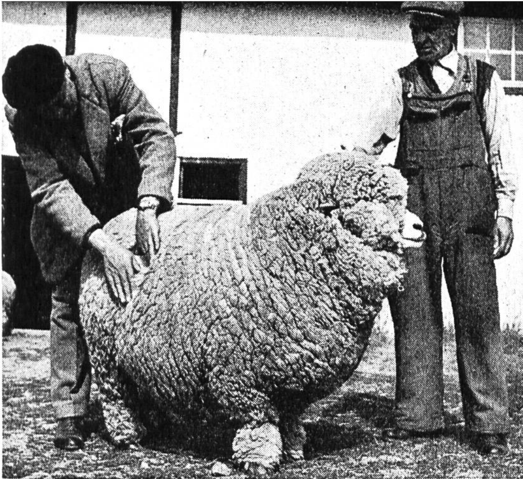
Ein preisgekrönter Schafbock der Rasse Corriedale auf der Estancia Maria Behety in Tierra del Fuego.

sind wir in die immer trockener werdenden nördlichen Teile von Patagonien gekommen.