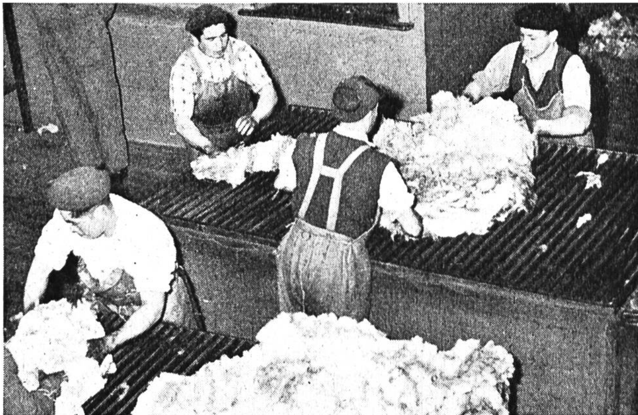
Zusammenpacken der Wolle in viereckige Bündel.

Argentinien teilen. Auch hier spielt die Schafhaltung die entscheidende Rolle in der Landnutzung.