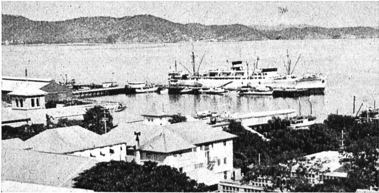
Blick auf den Hafen von Port Moresby, der Hauptstadt von Papua.

maschinen, Baumaterial und vor allem Lebensmittel. Es führt kranke und verletzte Eingeborene nach den wenigen Städten. Goroka ist der Hauptflughafen der östlichen Hochlande. Die Anwesenheit der Australier hat Frieden und Vertrauen gebracht. Neue Dörfer werden ohne Verteidigungsmauern gebaut. Die Kopfjägerei ist nicht mehr gefürchtet. Noch herrscht der Hackbau vor, bald wird die Maschine helfend eingreifen. Der Kontakt mit der übrigen Welt ist hergestellt. Neu-Guinea ist aus seinem Abseitsschlaf erwacht zu einem helleren und weniger mühsamen Dasein. W.K.