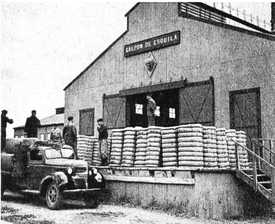
Lagerhaus der Estancia und Abtransport der je 300 kg wiegenden gepressten Wollballen.

250000 Schafe, eine gewaltige Zahl. Freilich ist die Wolle noch fettig und schmutzig; bei der Reinigung wird sie bis zu einem Drittel oder mehr ihres Gewichtes verlieren. Hans Boesch