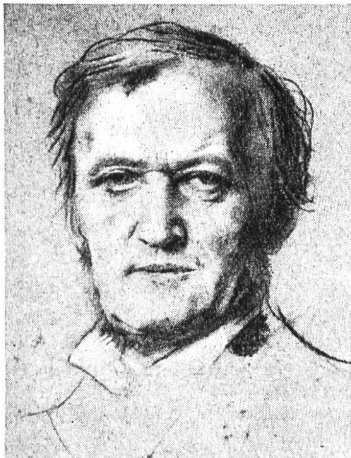
Richard Wagner, 1813–1883. Rötelzeichnung von Franz von Lenbach.

nen Wiese bei der Stadt von Brett und Balken ein rohes Theater nach meinen Plänen herstellen ... Also – schafft mir 10000 Taler – weiter nichts!»