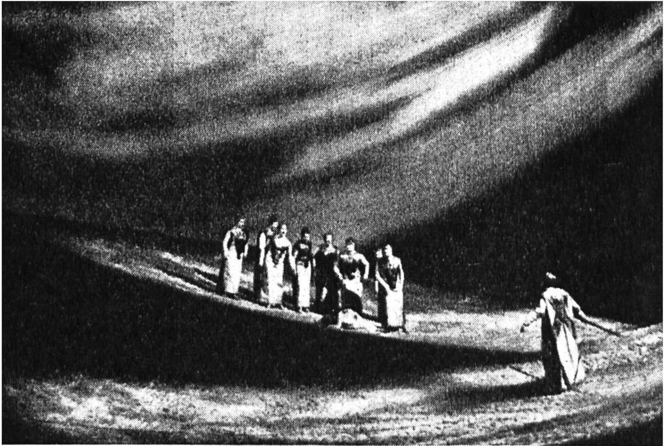
«Die Walküre», III. Akt. Bayreuther Festspiele.

verbindet er sich mit seines großen Freundes Liszt Tochter Cosima zu glücklicher Ehe. Dort entstehen auch die «Meistersinger von Nürnberg», reift der Entschluss heran, sein in Zürich erträumtes primitives Theater in Bayreuth zu errichten. Noch ist das Ziel weit, die Hindernisse erscheinen unüberwindlich. Allein Wagner meistert sie. An seinem neunundfünfzigsten Geburtstag, dem 22. Mai 1872, legt er auf dem inzwischen berühmt gewordenen Grünen Hügel den Grundstein zu seinem Festspielhaus, in welchem sich nun ein zwanzigjähriger Wunschtraum zu greifbarer Wirklichkeit verdichtet. Dieser Stein schließt eine Kapsel ein, die einen tiefen Sinnspruch enthält: