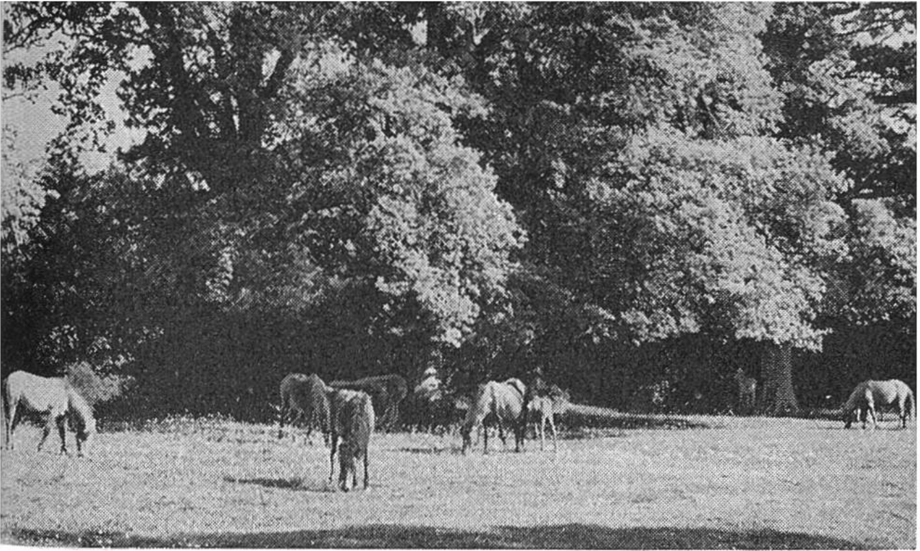
Unter den gewaltigen Bäumen weiden die Ponys friedlich in kleinen Herden von zwanzig bis dreissig Stück.

heute über 100 Quadratkilometer. Zwei Drittel davon gehören der Krone, der Rest einigen hundert Kleinbesitzern.