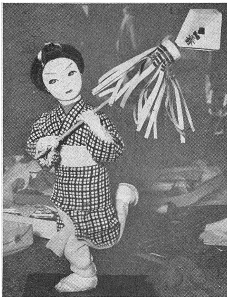
Eine in der Schule soeben fertiggestellte Puppe. Sie stellt den Feuerwehrhauptmann dar, allerdings als einen Knaben. Er rennt mit der Standarte, die er an die Stelle oder in die Richtung stellt, wohin das Wasser zum Löschen gespritzt werden soll.

Minister und andere Puppen ihren Platz. Häufig stellen die Mädchen noch ihre sämtlichen Spielpuppen auf die untersten Stufen, damit alle auf diese Weise einmal im Jahre zu Ehren kommen. Diese Sitte geht bis ins 9. Jahrhundert zurück. Früher machte man die Puppen aus Papier, und diese wurden am 3. März als Talisman für das Wohlergehen der Familie unter Gebeten in den Fluss geworfen. Später kam die Sitte auf, die Puppen in Festschmuck in einer bestimmten Reihenfolge, wie oben beschrieben, aufzustellen. Die Japaner haben seit alter Zeit eine besondere Vorliebe für Puppen, und das Fest der Mädchen am 3. März nennt man im Volksmund das Puppenfest. Gegen Ende Februar bis Anfang März sind in Japan viele Schaufenster mit Puppen für das Puppenfest geschmückt, ähnlich wie bei uns zu Weihnachten die Schaufenster das Gepräge dieses Festes erhalten.