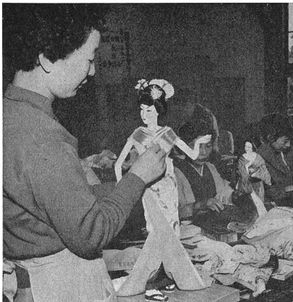
Die Schülerin kleidet eine Puppe an. Sie ist gerade dabei, die Kragen, die manchmal aus mehreren Schichten bestehen, anzubringen.

Als im Jahre 1923 das grosse Erdbeben einen grossen Teil Tokios in Asche gelegt hatte, sandte Amerika unter anderem viele Puppen nach Japan. Das japanische Volk war hierüber sehr gerührt.