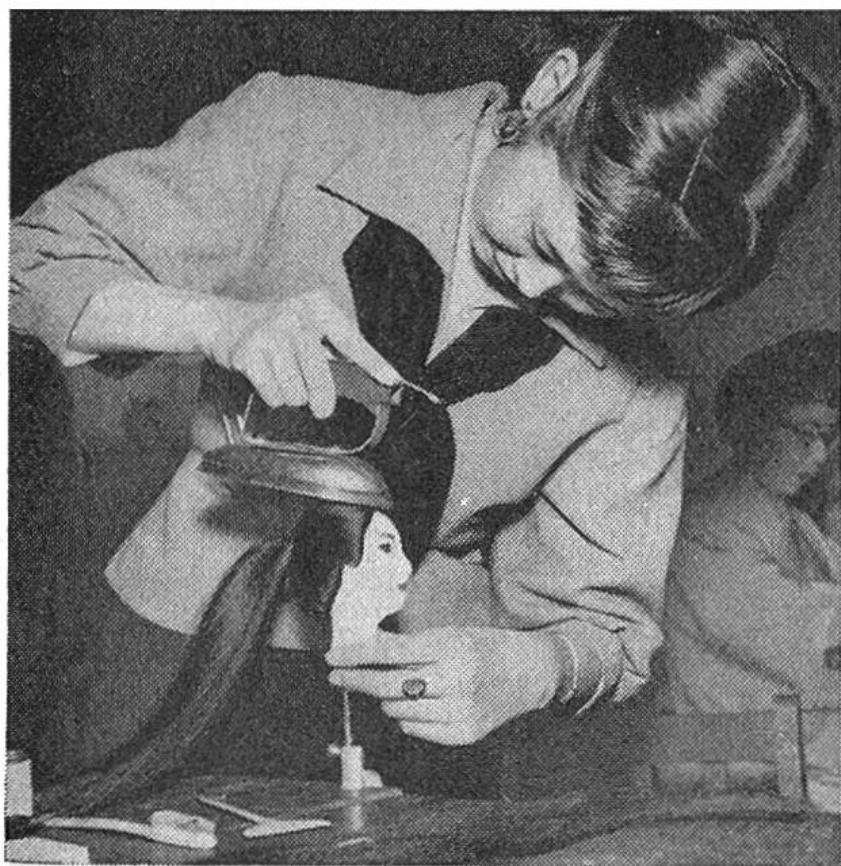
Eine Schülerin, die den Puppenkopf friert, indem sie das Bügeleisen benutzt, um das aus schwarzem Seidengarn bestehende Haar in die richtige Lage zu bringen. Ein Kamm mit vertikalem Längsstiel und eine Bürste, ähnlich wie eine Zahnbürste, liegen auf dem Werk Tisch.

aufgestellt, und zwar Krieger und bekannte Helden in voller Kriegsrüstung. An langen Stangen werden hoch über den Dächern Stoff- oder Papierkarpfen in schwarzer oder roter Farbe befestigt, die aufgebläht im Winde flattern. Der Karpfen ist das Zeichen der Tapferkeit; denn es heisst, dass Karpfen gegen die Stromschnellen schwimmen können und, wenn sie gefangen werden, so lange zappeln, bis sie auf ein Brett gelegt und einmal mit dem Küchenmesser bestrichen werden. Dann verhalten sie sich ganz still und erwarten mit stoischer Ruhe den Todesstreich.