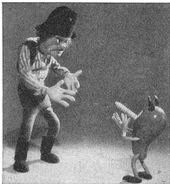
Der zornige Bauer wird von der kleinen Kartoffel verspottet.