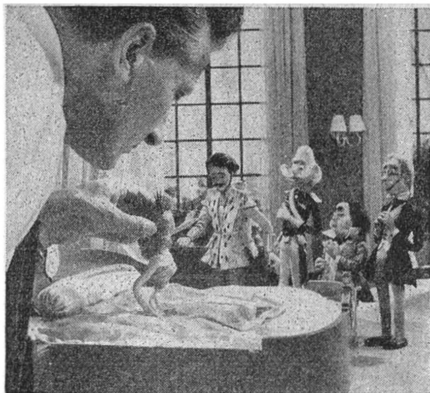
Die Prinzessin in ihrem Prunkbett wird für die nächste Szene bereitgemacht.