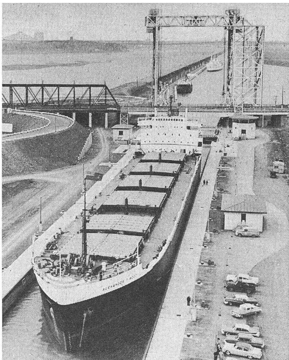
«Alexander T. Wood» (14326 RT) verlässt die St. Lambert-Schleuse und beginnt die Fahrt flussaufwärts.

Großschifffahrtsweg und Wasserkraftnutzung stellen die beiden Ziele dar, welche der seit 1954 von den USA und Kanada gemeinsam gebaute St. Lawrence-Seeweg verwirklicht. Am 26. Juni 1959 eröffneten Königin Elisabeth II. und Präsident Eisenhower den Seeweg. Die Vereinigten Staaten haben dadurch – wenn man es so ausdrücken will – eine vierte Meeresküste erhalten, an der Millionenstädte, Industriezentren und reichste Landwirtschaftsgebiete liegen.